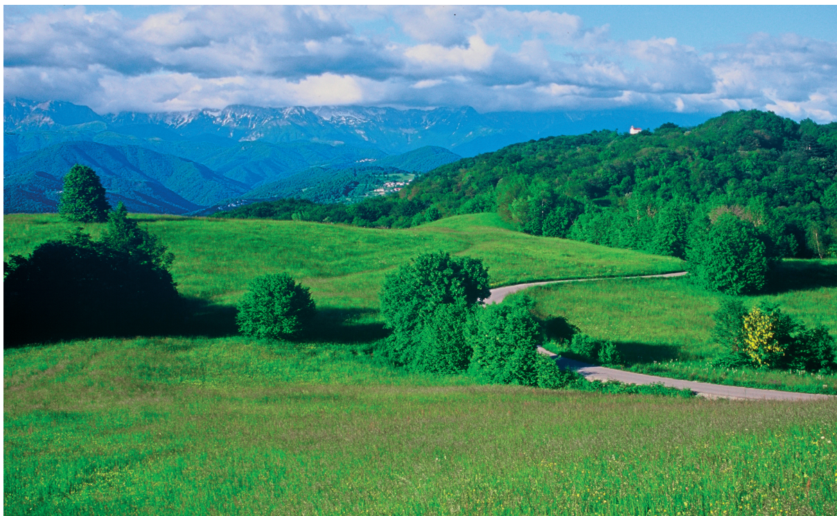
Slika 2: Kanalski Kolovrat, Pri Rajdi pod Korado, gorske senožeti, kjer raste tudi ilirski meček ( Gladiolus illyricus ). Figure 2: Kanalski Kolovrat, Pri Rajdi under Korada, montane grasslands with Gladiolus illyricus.