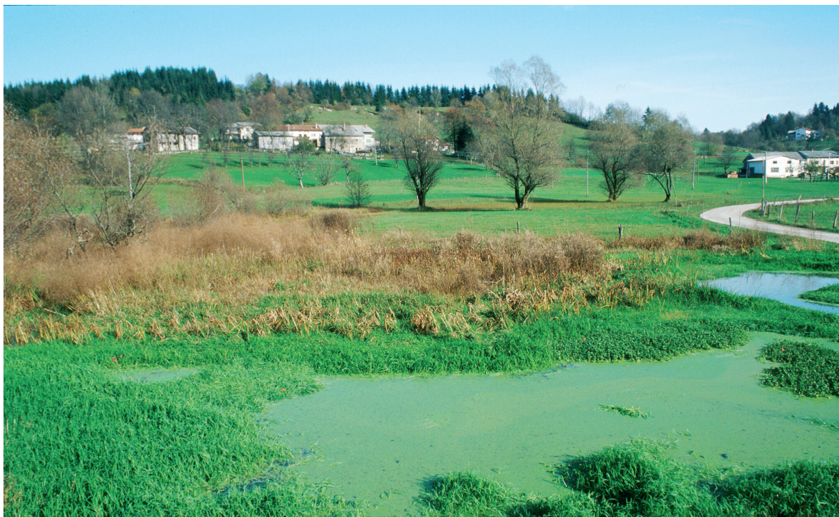
Slika 4: Mlaka pod Mrcinjami na Banjšicah, preproge grbaste vodne leče ( Lemna gibba ) Figure 4: Mlaka below the village of Mrcinje on the Banjšice plateau, carpet of Lemna gibba .