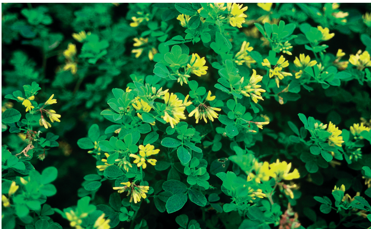
Slika 5: Pironova meteljka ( Medicago pironae ) pri Sv. Jakobu (Kanalski Kolovrat). Figure 5: Medicago pironae near Sv. Jakob (Kanalski Kolovrat)