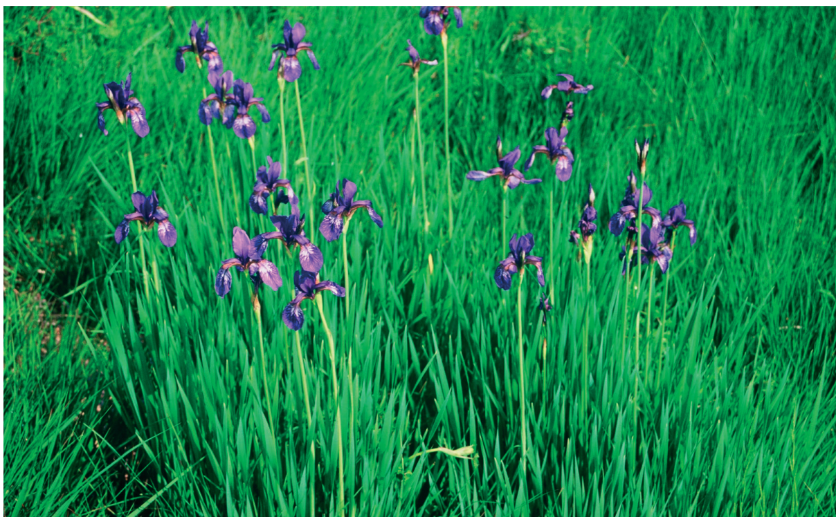
Slika 3: Kojniška perunika ( Iris sibirica subsp. erirrhiza ) na Banjšicah (Sleme). Figure 3: Iris sibirica subsp. erirrhiza on the Banjšice plateau (Sleme).