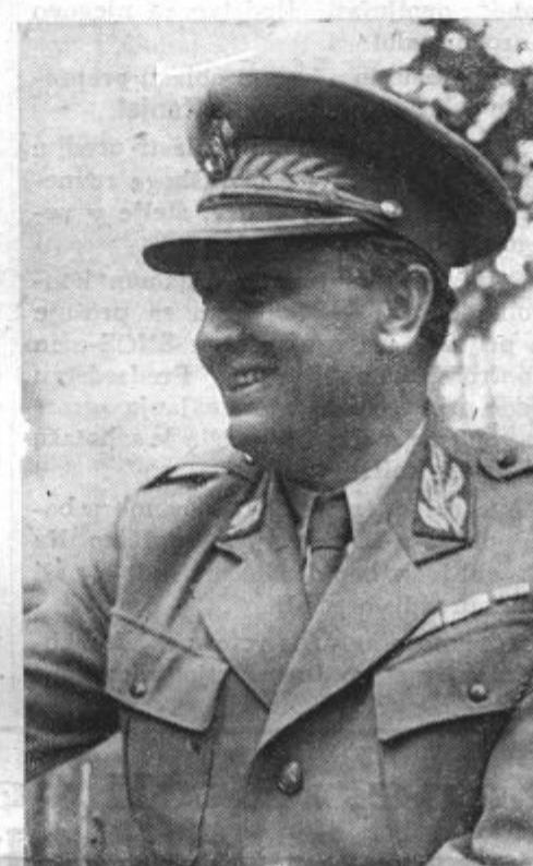
Nosilec liste Ljudske fronte tov. maršal TITO

Ko bo zgodovina pisala o junaški borbi jugoslovanskih narodov pod vodstvom maršala Tita, prav gotovo ne bo pozabila omeniti deleža, ki smo ga doprinesli za osvoboditev svoje domovine mi savinjski, pohorski in kozjanski kmetje. Zavedali smo se, da se borimo za nekaj novega, za nekaj veličastnega — za novo Titovo Jugoslavijo. Vedeli smo, da se borimo obenem tudi za svoje kmečke koristi, za svoje domove in