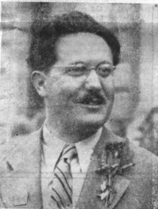
Tov. Kardelj, podpredsednik Zvezne vlade