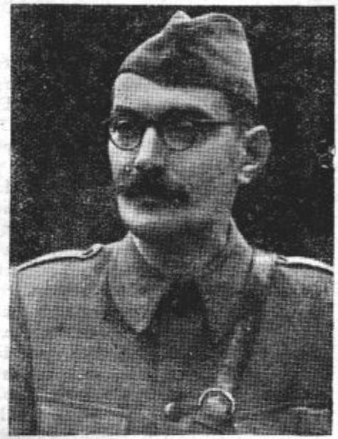
Minister tov. Leskošek nosilec okrožne kandidatne liste