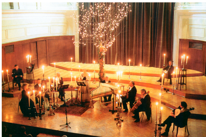
Prestol poezije, foto Božidar Dolenc

Z Meto Kušar se je o zmajih in hudičih današnjega časa pogovarjala Maja Ferjančič.