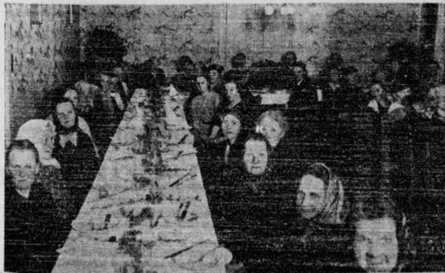
Bestintrideset mater, ki so rodile po 14 ali več otrok, je bilo v nedeljo v srebrni dvorani Uniona lepo pogoženih in počaščenih. Bog živi zlato slovenske manice!

d Mleka manjka. Zveza mlekarских zadrug nas prosi, da objavimo: Na nas se obračajo številni interesentje s prošnjami, da jim priskrbimo mleko oziroma jim pojasnimo, od kod naenkrat tako hudo pomanjkanje mleka. Pojasnjujemo, da primanjkuje mleka zaradi tega, ker je nastopilo silno pomanjkanje krme; krme pa primanjkuje, ker kmetje po-