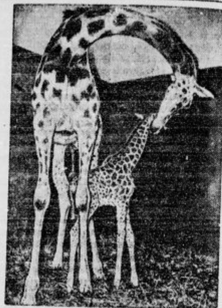
Žirava v nekem nemškem živalskem vrtu je dobila mladiča, ki je bil prvi dan 1 m 60 cm visok.

d Še en požar. Zločinaka roka je podtaknila v vasi Hrib pri Sinjem vrhu požar, ki je uničil petim posestnikom vsa gospodarska po-