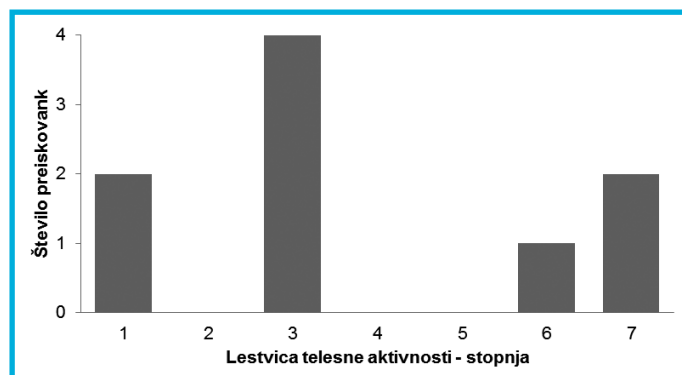
Slika 2: Porazdelitev ocen na lestvici telesne aktivnosti (LTA)