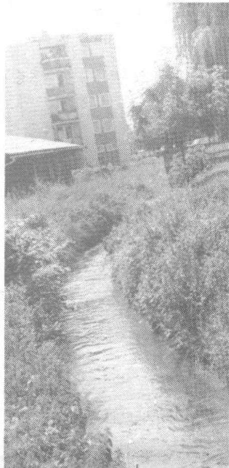
Delavci TOZD Hidrogradnje bodo očistili in obnovili strugo Gradašče