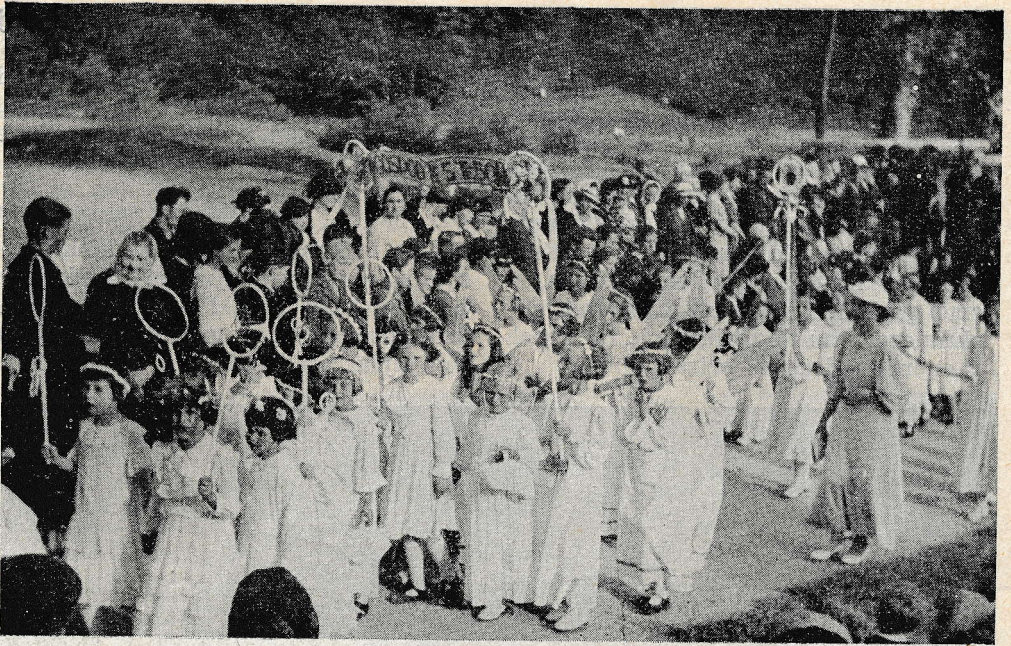
Skupina belooblečenih deklic v procesiji.