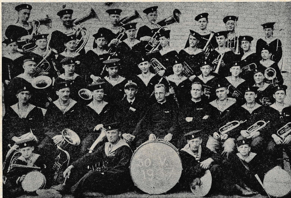
Godba rakovniških oratorijancev.

Tako naglo se je širilo mnenje o njegovi svetosti, da je škofijski ordinarijat v Turinu začel resno preiskovati njegovo življenje, kar je trajalo celih pet let. Lanskega leta 14. januarja pa je rimska kongregacija za obrede uvedla, po potrditvi samega papeža, apostolski proces za njegovo blaženstvo. Prav ob stoletnici njegovega rojstva, njega, ki je bil za salezijance živo pravilo, za katoliški svet pa drugi don Bosko.