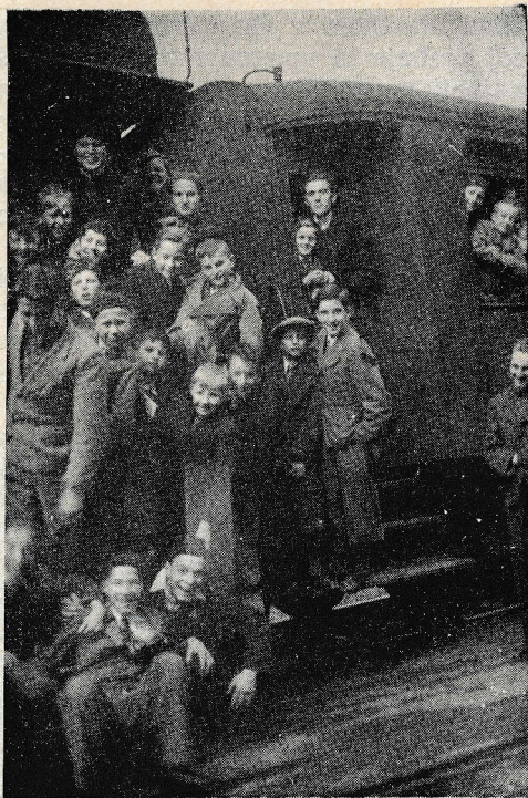
Veselo razpoloženje pred odhodom z izleta na Radno.

Učiti se glasbe je bilo dovoljeno le pridnejšim učencem, ki so v šoli dobro zdelovali, tako je bila za ene nekaka nagrada za pridno učenje, za druge pa spodbuda. Glasba je v don Boskovem zavodu velik vzgojni činitelj in ga je don Bosko sam z velikim uspehom gojil. Ob končanih štirih letih bodo dobili učenci Glasbene Matice spričevala, da so dovršili tečaj uglednega glasbenega zavoda.