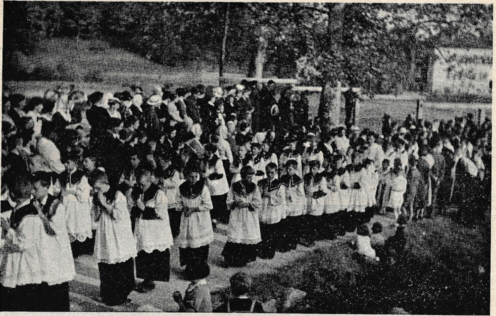
Skupina ministrantov v procesiji na praznik Marije Pomočnice.

dvanajste ure ponoči je bila ura molitve z govorom, ljudje pa so vso noč vztrajali v cerkvi, molili so in prepevali. Ob pol štirih se je začelo deliti sveto obhajilo, nakar je sledila prva sv. maša. Druge sv. maše so se vrstile neprestano do pol dvanajste ure. Ljudstvo pa je še vedno vztrajalo. V nedeljo se je nebo zjasnilo, da smo se brez skrbi pripravili na procesijo.