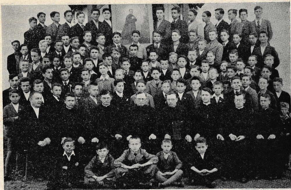
Predstojniki in gojenci v Martinišću v Murški Soboti.

najlepši vseh praznikov, kar jih je doživelo Martinišče. Tako veličastnega Marijinega slavlja Sobota še ni videla. Posebno krasna je bila procesija z Marijinim kipom na praznik popoldne. Hvaležni smo Mariji za ta lepi dan!