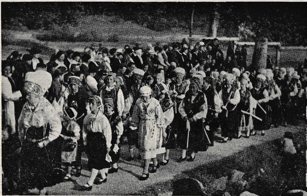
Skupina narodnih noš v procesiji.

Dne 5. junija so šli naši dijaki zadnjič v šolo. Naslednji dan, v nedeljo je bil poslovilni dan. Povabljeni so bili tudi gosposdije profesorji z gimnazij, da jim dijaki pred odhodom na počitnice