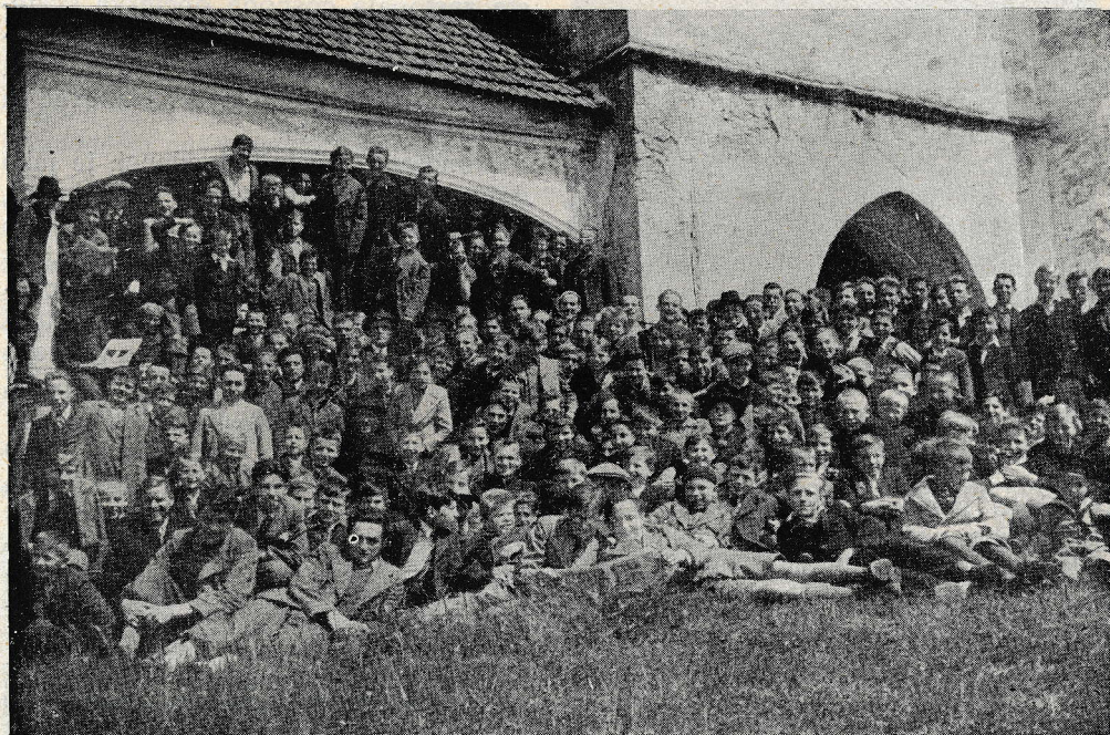
Rakovniški gojenci na izletu pri sv. Roku nad Sevnico.

Pouk na zavodu so prevzeli (naj si bo zavestno ali slučajno, vendar zelo simpatično) člani Ljubljanskega kvarteta in so na tej produkciji s svojimi