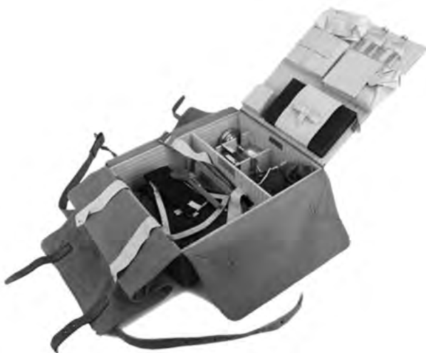
Oprema vojaškega kurata.

Ob zavedanju, da so slovenske dežele pomenile le majhen del dvojne mornarije, je mogoče reči, da je bil delež vpoklicanih duhovnikov znaten, in to predvsem glede na nemško govoreče škofije. Pri tem bi se najverjetneje – v primerjavi z nekaterimi škofijami, ki jih navaja Bjelik v že omenjenem poročilu in so prispevale po več kakor 50 ali celo 100 vpoklicanih kuratov 616 – posamezne obravnavane škofije (npr. lavantinska) uvrstile približno na sredino.