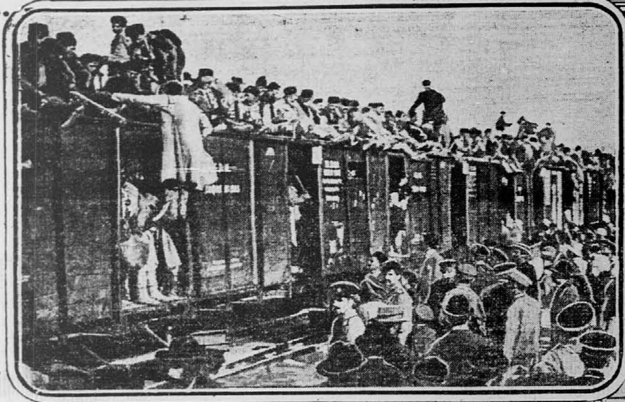
SERBIAN RESERVISTS LEAVING SOFIA TO REINFORCE THE BULGARIANS IN FRONT OF ADRIANOPLE