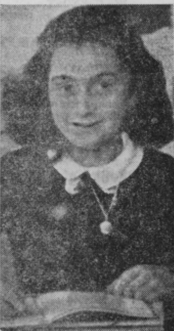
OKRAJNO GLEDALIŠČE PTUJ