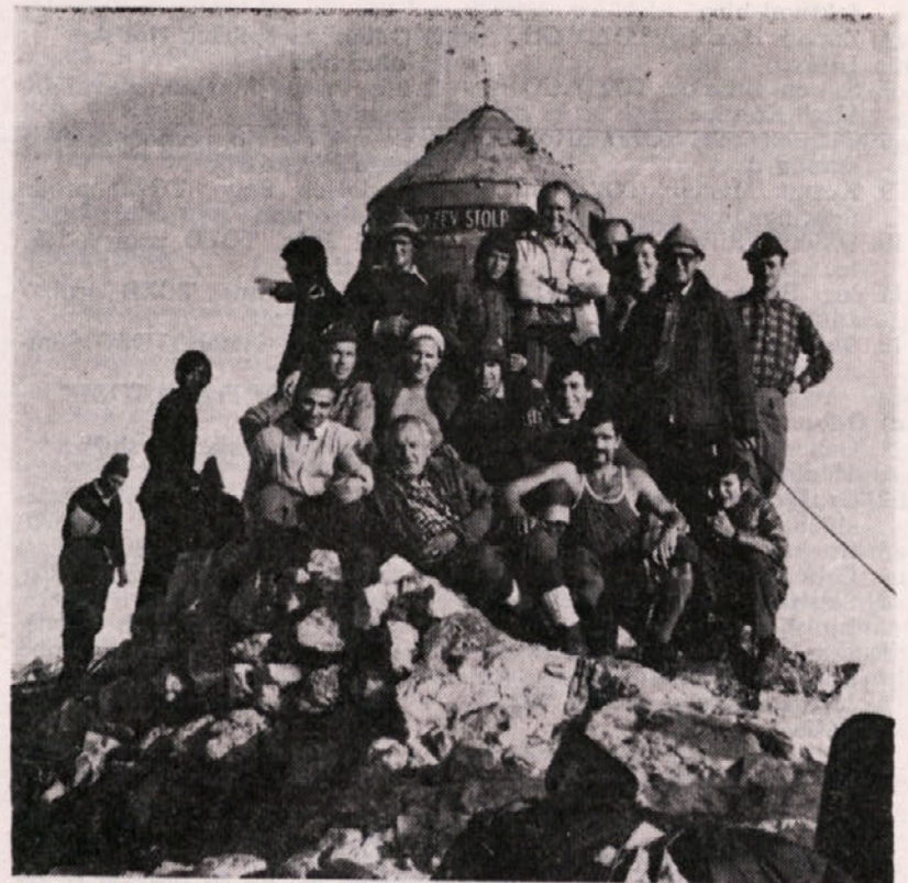
Letošnji največji podvig planinske sekcije SŠD Ingrad je bil vzpon na Triglav. Najmlajši udeleženec 11 let, najstarejši 61 let

zgodbe, te praktično ni, nič se ne dogaja, kamera miruje, igralci skoraj ne govorijo. Vendar dogajanje kljub temu obstaja in sicer v igralcih samih. V času vojne prihajajo na mirno kmetijo Italijani, Nemci, belogardisti, plavogardisti, partizani, borci za kralja in še kateri, vsi pa zahtevajo, da se mladi kmet priključi prav njim. Dolžnost ga vleče na eno stran, strah pred odločitvijo in smrtjo na drugo. Dogodkom ob strani ne more stati, eni kot drugi pa poznajo samo orožje in kri. Torej kam?