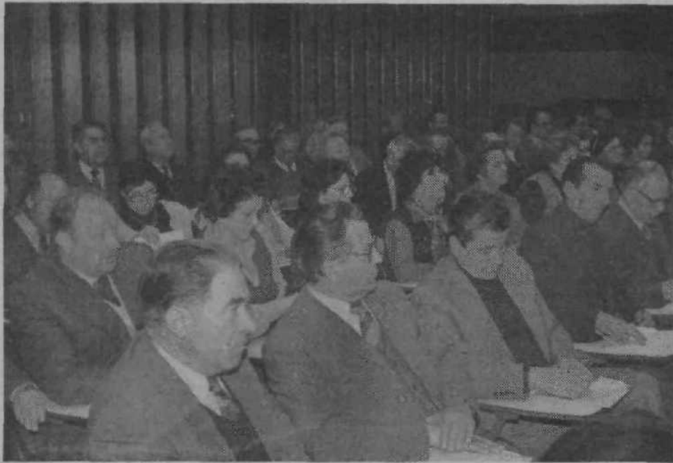
SKUPŠČINA OBČINSKE ZVEZE ZDRUŽENJ BORCEV NOV