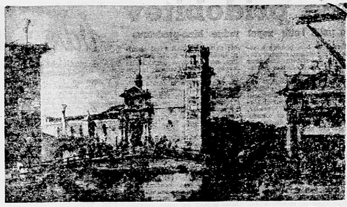
Francesco Guardi: Vhod v Arsenal v Benetkah. (Z razstave »Od Tiziana do Tiepola«)