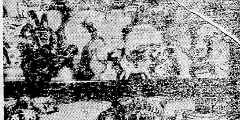
Iz Narodnega muzeja v Ljubljani: zbirka stare keramike