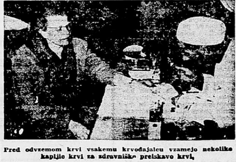
Pred odvzemu krvi vsakemu krvodajalcu vzamejo nekoliko kapljico krvi za zdravniško preiskavo krvi.