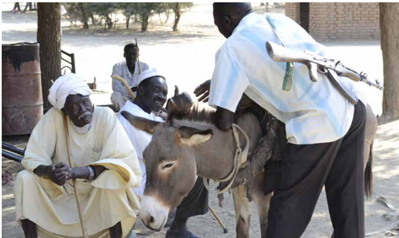
Tako imenovani uporniki v vasi Tungole, na severni fronti v Nubskih gorah. V resnici borci za svobodo pred nekdanjimi lovci na sužnje in zdaj, v novem tisočletju, ko črni sužnji nimajo več cene – iztrebljevalci.

49-kubičnim motorjem, ki mi je omogočal mobilnost tudi v deževni dobi. Prečkal sem največja močvirja na planetu in v njih od črnih borcev za svobodo pred lovci na sužnje izvedel, da so civiliste tri leta prej v vasi Šilukov Kaka pobili vladni bombniki zato, da bi očistili naftna polja, ki jih je odkrila ameriška korporacija Chevron, divjakov in vsega divjaškega in divjega. In tako z dobičkom prodali koncesije ne samo kitajskim in ruskim naftnim »kompanijam«, ampak tudi znanim multinacionalkam s sedeži v članicah Evropske unije.