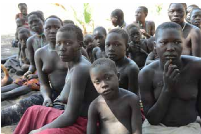
Bolj ko so domačini indigeni, bolj so ogroženi in ranljivi. Ljudstvo Komoganza, Modri Nil, Sudan, 2011.