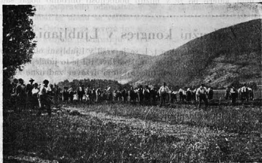
S tekme koscev v Podhosti pri Toplicah.

Mnogo takih tekem bo mogoče izvesti tudi v zimskem času, ko imamo več časa in prilike. Zato naj se naša društva n. pr. skupno slikajo, a naj primerno število slik obdržijo v svrhu nekakih diplom, katere naj razdelijo odličnjakom tekem. Ko bo na pr. na članskem sestanku običajni dnevni red izčrpan, naj se sestavijo primerna vprašanja kakor: 1. kaj mora vedeti dober gospodar, 2. kaj znati dobra gospodinja, 3. v čem tiči blagostanje in napre-