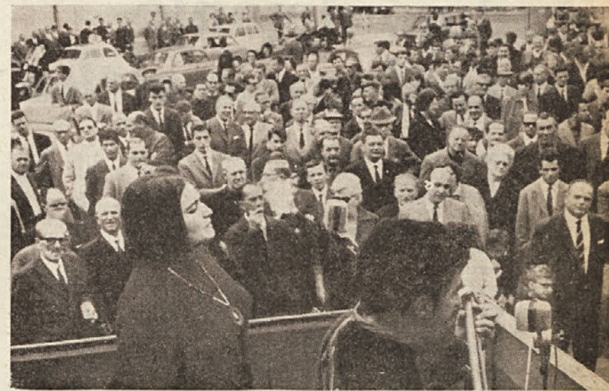
Preteklo nedeljo je tržaška mladina priredila originalno manifestacijo. Nastopili so pevci in kitaristi s pestrim sporedom pesmi proti vojni in proti fašizmu