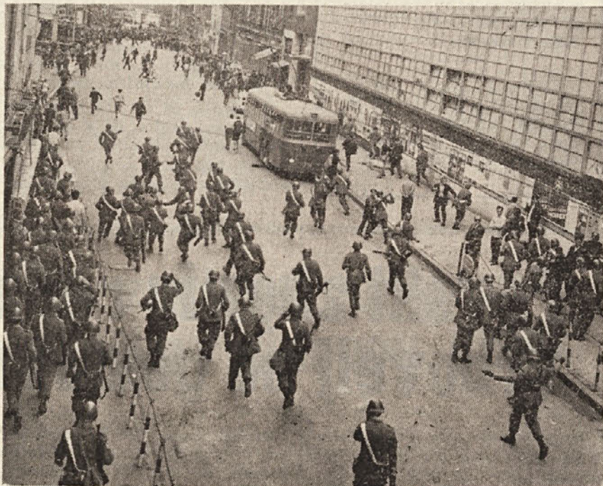
Policijski nastop proti tržaškim delavcem, ki so manifestirali proti sklepom vlade in CIPE je povzročil hudo ogorčenje. Ta nastop je bil v očitnem nasprotju s pravicami državljanov, ki jih določa ustava. S pendreki, solzilnimi bombami ni mogoče rešiti perečih problemov

rezervoarja v Števerjanu še eno cev, da bi se na ta način povečala zmogljivost vodovoda. Do sedaj pa si ni uprava še na jasnem kod bi speljala vodovodne cevi. Ze trikrat so v ta namen merili traso, toda vsakokrat drugod. Zadnjič, ko je bila trgatev v teku, so merili zemljo v bližini ceste Oslavje-Števerjan. Pri tem pa niso niti obvestili zainteresirane kmete. Zaradi tega so posestniki teh zemljišč nejevoljni. Ta nejevolja je upravičena, saj je števerjanska občinska uprava pred dvema letoma speljala vodovodne cevi na Valerišče po parcelah, ki so last kmetov, ne da bi se poprej z njimi dogovorila ter dobila potrebno privolitvev.