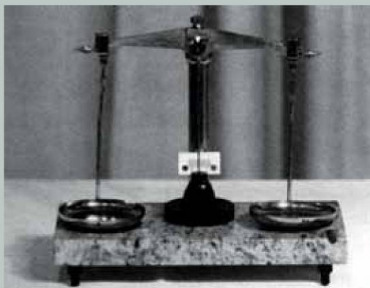
Precizna tehtnica. (iz zbornika: Tehnica 1959–2009 )

Precizne tehtnice je podjetje Niko Železniki proizvajalo na pobudo Borisa Kidriča, ki je na prvi povojni obrtni razstavi, leta 1949, v Ljubljani, Železnikarjem predlagal, naj razširijo proizvodnjo precizne mehanike in poleg šestil izdelujejo še analitske tehtnice. 1