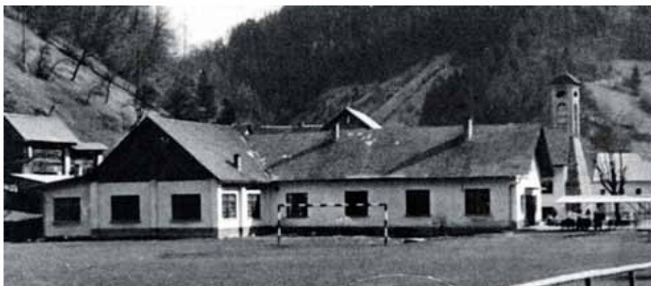
Poslovni prostori Tehtnice na začetku 60. let prejšnjega stoletja.