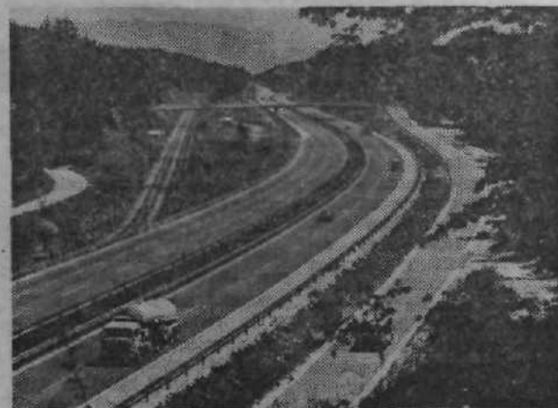
Avtocesta Vrhnika — Postojna, pododsek Unec.