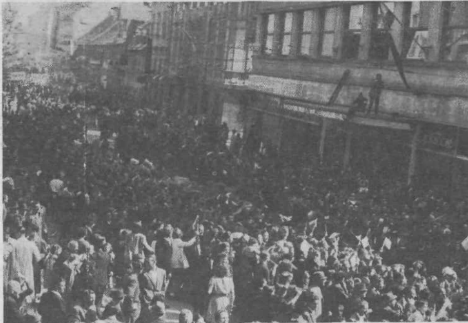
Zmago smo vsi skupaj, vojska in nepokorjeni Ljubljančani, primerno proslavili.

Če gledamo na današnjo mednarodno situacijo z odprtimi očmi in znamo potegniti iz posameznih primerov tudi nauke, lahko vidimo, da do takih intervencij od zunaj dejansko prihaja čez noč. In mora biti taka intervencija, ne glede na formalno opravičilo, tudi hitro končana. Kajti sicer napadalec ne doseže namena, saj ima proti sebi tako svetovno mnenje kot tudi naraščajočo opozicijo v lastnih vrstah. To nam kažajo konkretni primeri. Napadalcu je torej treba preprečiti preseženje, ki je prav gotovo strategija vsakega napadalca. Množičnost mora biti organizirana torej tako, da v sleherni sredini, v sleherni ulici, krajevni skupnosti obrambno delujemo. In da kljub pritiskom odpor v najhujših razmerah vsaj tli. Kajti agresor bo povzel vse možnosti, da že v kali zatre vsak odpor. To pa se ne sme dogoditi. Tudi če agresorju uspe uničiti objekte, floro in favno, kot se je to