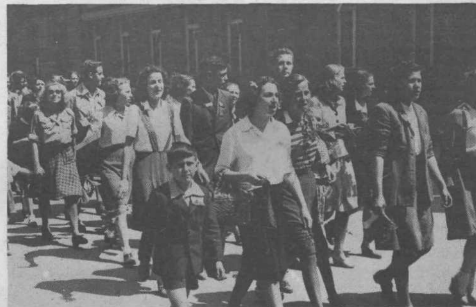
Ljubljančani so s pesmijo pozdravili svoje partizane.

Resolucija VIII. kongresa ZKS in predlog resolucije 11. kongresa ZKJ posvečata veliko pozornost, natančneje povedano, temeljno poanto pravici delovnega človeka, da razvija svojo varnostno kul-