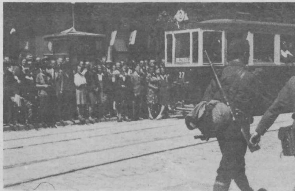
Na vsakem koraku so jih spremljale navdušene množice.

mogla, jih je napisala takoj po šoli. Zjutraj je odšla v šolo navadno brez zajtrka. Materi je rekla, da če se naje, v šoli ne zna najbolje. Tudi med sošolci je bila zelo priljubljena. Ko je končala osnovno šolo je pregovorila starše in se vpisala v meščansko šolo v Ribnici. Starši pa je niso zmogli dolgo šolati, zato si je morala poiskati delo. Šla je za trgovko in trdo delala, saj se ni smela izogniti še tako težki vreči. Bila pa je poštena, bistra in ljubezniva.