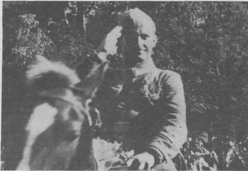
Ponos pravega zmagovalca ob velikem dnevu.

Pri nas veliko dajemo na izobraževanje, vse premalo pa na vzgojo. Naj nekoliko natančneje razmejim oba pojma. Teoretično imamo vse stvari lepo razčiščene, dosegljive. Pri konkretni izvedbi