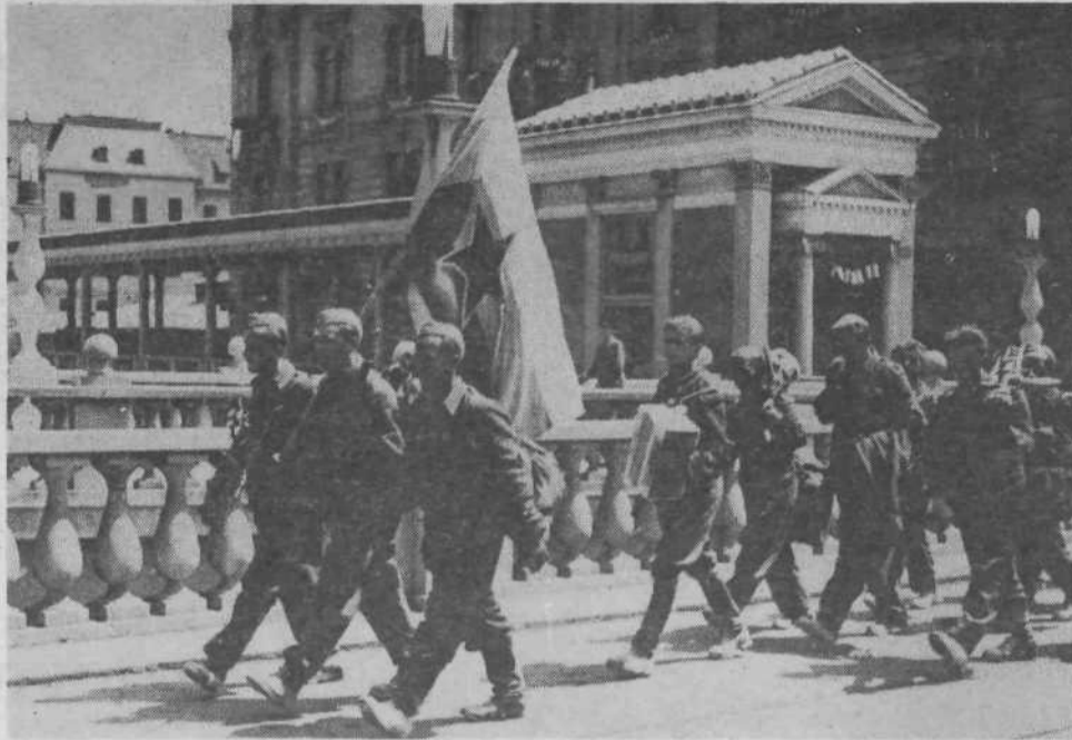
Štiri leta po prihodu prvih okupatorjev je prišla svoboda.

Kljub vsem tem prizadevanjem pa je to področje našega delovanja še vedno med bolj perečimi vprašanji. Verjetno bo treba v krajevni skupnosti zbrati določena finančna sredstva, s katerimi bomo