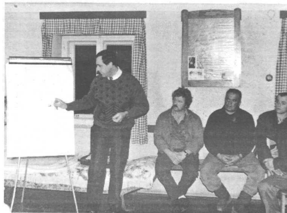
Predstavnik ZOP a na srečanju s krajani Preproč

rokada d.d. podjetje za promet z nepremičninami, Ljubljana, Prazakova 8/1 tel.: 316-653, 13-24-317 faks:13-24-203