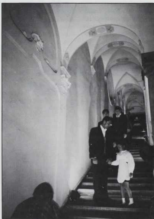
Modna revija je bila na bližnjem stopnišču, zato jo je videlo manj obiskovalcev, kot če bi bila v večji dvorani ali na ulici

Na ta način se Mura zgleduje po najpomembnejših svetovnih proizvodnih, trgovskih in bančnih hišah, ki že imajo svoja predstavništva in trgovine v Budimpešti. Zategadelj niti ni aktualno vprašanje, koliko Madžarov si lahko privoščijo srajco za 14 tisoč forintov ali obleko za 53 tisoč forintov (bralce opozarjamo, da so zapisane številke točne in ne gre za napako; zlasti tiste, ki imajo manjšo