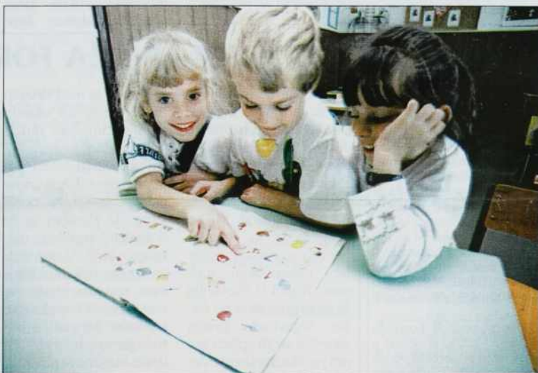
V monoštrski OŠ so na veselje nas vseh spet 3 prvošolčki, ki se učijo slovenščino.

Med počitnicami pa nas je spet razveselilo darilo naših prijateljev iz Švice, člani društva slovenskih izobražencev Pro Cultura Slovenica so namreč našim vrtcem nakazali finančno pomoč 800 frankov; vrtci so se darila izredno razveselili, saj vemo, da je njihov materialni položaj izredno težek. Iskrena hvala darovalcem, o izročitvi bomo poročali v naslednji številki, kjer bomo objavili tudi daljši za-