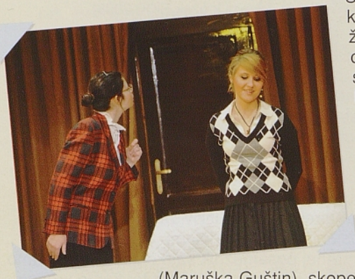
Premiera na Opčinah