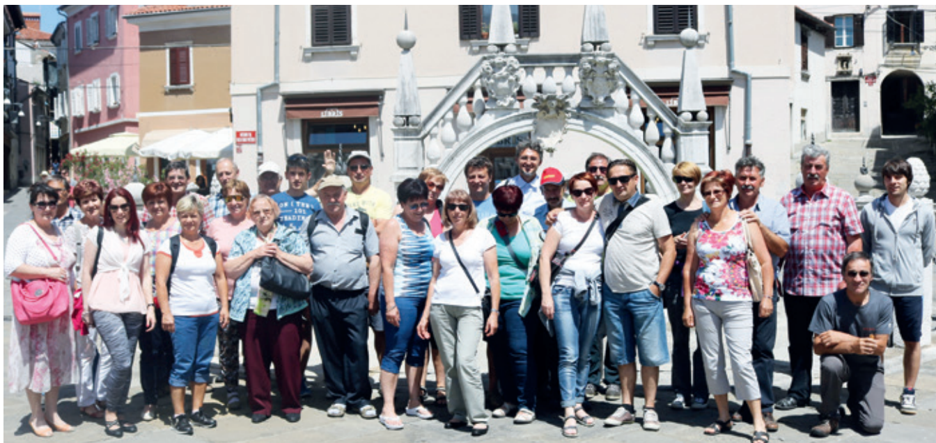
Sončno vreme, dobro vzdušje, v ozadju pa Da Pontejev vodnjak.

V prvih poletnih dneh junija smo se člani KD odpravili na strokovno ekskurzijo v Slovensko Primorje in zamejsko Slovenijo. Odpravili smo se na geografsko in zgodovinsko poseben del Slovenije, ki izstopa tako po morfologiji terena kot po zgodovinskih dogodkih v preteklosti in tudi danes. Flišna pokrajina s 46,6 km dolgo obalo, pomembnim srednjeevropskim pristaniščem – luko Koper, mediteransko klimo in bogato kulinariko privablja turiste od blizu in daleč.