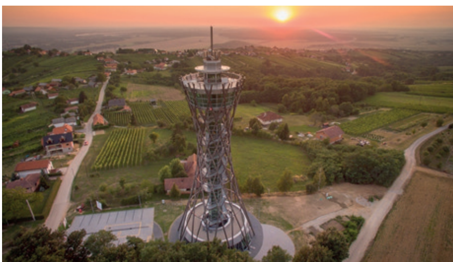
Razgledni stolp »Vinarium« v osrčju Lendavskih goric

ke Špele Fišer. To je bil pravi uvod v obisk razglednega stolpa Vinarium, ki je pomenil vrhunec našega izleta. Kako je nastal razgledni stolp Vinarium?