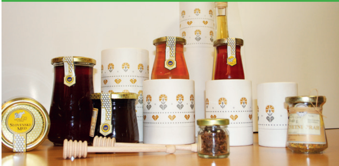
Čebelji pridelki so darilo čebel in narave - podarite košček narave.