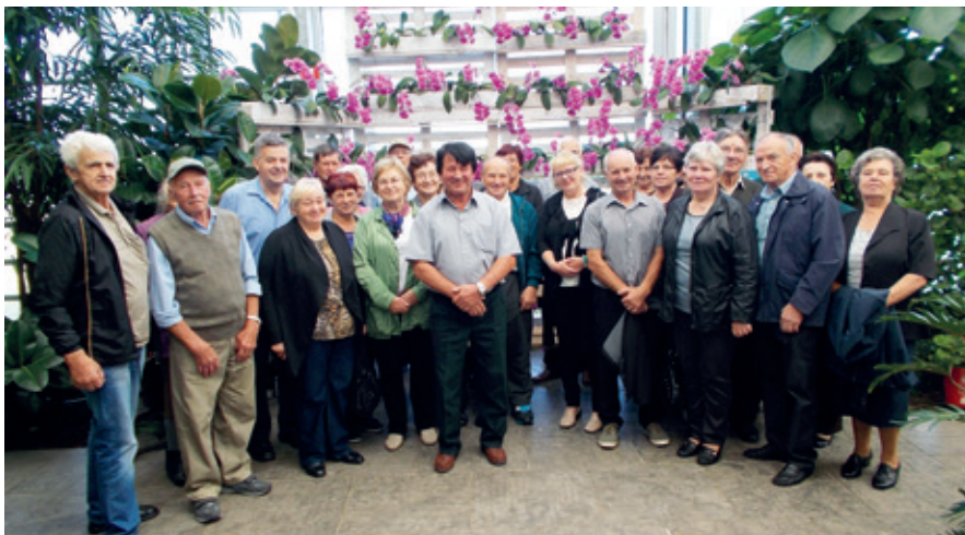
Člani Društva upokoencev Žetale v tropskem vrtu podjetja Ocean Orchids d.o.o. v Dobrovniku.