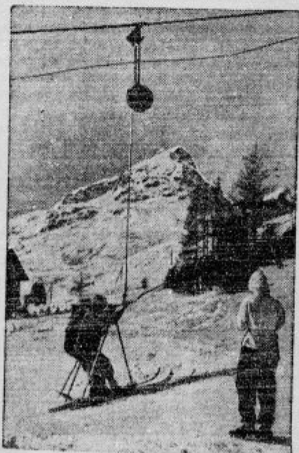
V St. Moritzu v Švici so napravili za smučarje posebno vzpenjačo, ki športnike potegne 2000 m visoko, da jim ni treba z napornim plezanjem nazgor izgubljati časa

prepovedano vernikom sleherno sodelovanje s prostozidarji (framasoni), socialisti in drugimi organizacijami, ki so odkrite ali tajne sovražnice cerkve in delajo propagando za versko mlačnost. Katoliška cerkev bo pazljivo spremljala delovanje komunistov. Treba je z vsemi sredstvi začeti boj proti komunizmu in nastopiti proti njegovim protiverskim geslom