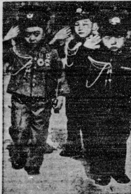
Na Japonskem je vse nemške navdušene za vojno proti Kitajski. Medu je predpisala celo za male otrocite generalsko in admiralke uniforme.

d Za tiste, ki bežejo iti na letošnji mednarodni eharistični kongres v madžarsko Budimpešti. Vodstvo mednarodnega eharističnega kongresa, ki bo v maju mesecu v Budimpešti, je za slovensko službo boljše v dneh kongresa namenilo cerkev bolnišnice sv. Elizabete, za Hrvate pa kapucinsko cerkev. Obe sta v eni izmed glavnih ulic Budima (Füüta), druga od druge oddaljeni dobrih pet minut. Kapucinska cerkev more sprejeti kakih 800 ljudi, cerkev sv. Elizabete pa do 600. Cerkvi ležita blizu Donave nasproti parlamenta. V neposredni bližini je viseči most čez Donavo, čez katerega se v najkrajšem času pride v središče mesta in do kraja glavnih slovesnosti. Med tema dvema cerkvama je budimski društveni dom.