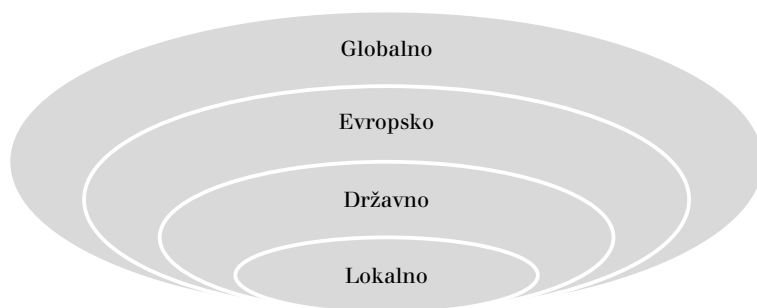
SLIKA 2 Ugnezdeno državljanstvo

dna pripadnost se opredeljujeta na novo, za svetovno umestitev, in ta pojma sta zdaj bolj vključujoča kot sta bila. Na primer, državljanska vzgoja zdaj spodbuja strpnost, spoštovanje raznolikosti in odprtost do drugih kultur; kot smo že omenili, te vrednote in nagnjenja odražajo sodobne zahteve državljanstva v svetu s čedalje manj jasnimi mejami in vse bolj raznolikimi družbami. Po teh veččinah se povprašuje tudi v novi svetovni ekonomiji, zato je državam v pomoč pri krepitvi nacionalnega gospodarstva. Lahko bi torej trdili, da je to, da postajamo bolj svetovni in/ali evropski, domoljubno dejanje, saj lahko mladi ljudje z razvijanjem takih nagnjenj pomagajo svoji državi konkurirati na svetovnem trgu.