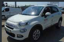
500X. Pop star. Privlačna barvna kombinacija.