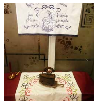
Pred pogostitvijo smo si v pred-dverju Centra Ivana Hribarja ogle-dali razstavo ročnih del vezilj.