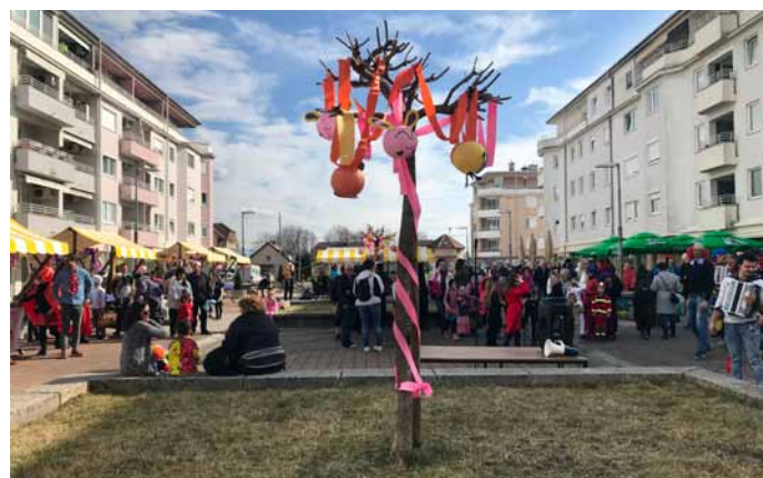
Ploščad med trzinskimi bloki, polna pisanih maškar

zaželel dopolnitve ali na novo zarisane pustne maske. Tako so svoj videz izpopolnili pikapolonice, metuljčki, strašni zmaji in veseli klovni, izvirne lubenice in drugi sadeži, pa organi zakona, gasilci, mačke, tigri, miške, naslovne junakinje iz priljubljene nadaljevanke Soi Luna, indijske princeze, samuraji in še mnogo drugih bitij. Ličenja so se z veseljem udeležili posamezniki in skupine vseh starosti.