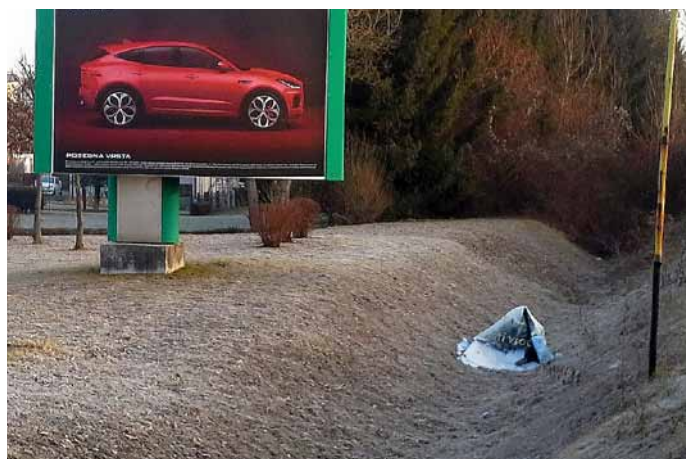
Zgoraj nova limuzina, spodaj papirnata starina.