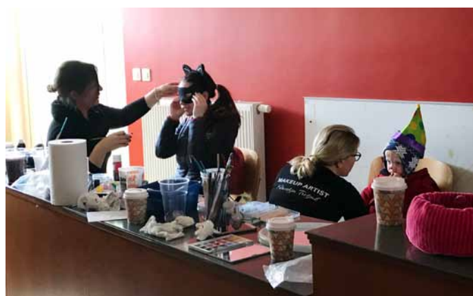
Umetnici ličenja sta udeležencem pustovanja izpolnjevali pustne želje.

šalo po mesnih jedeh, je poskrbela gostilna Trzinka, gostilna Pr` Jakov Met in restavracija Putr sta ponudili sladki del, mesnica Pr` Kmetič