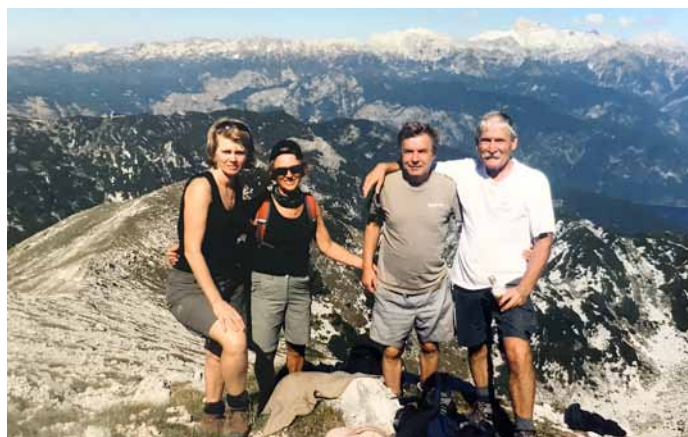
Med uživanjem ob lepotah slovenskih planin, v družbi žene, družinske prijateljice in njenega partnerja.

Kot je začel, pravi, bo tudi končal. Kot kajžar. Z ženo sta svoje imetje že razdelila med potomce, saj menita, da materialnih do-