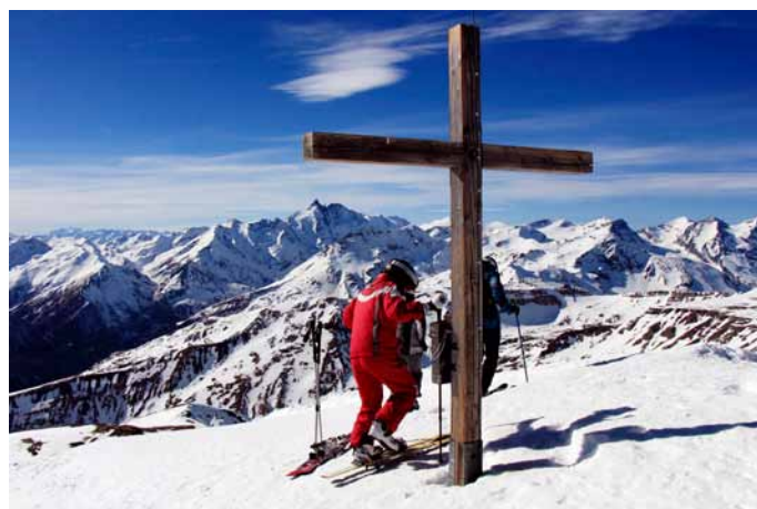
Kadar je doma snežna revščina, se lahko odpravimo tudi v bolj zasneženo sosedstvo. Na sliki je pogled proti Großglocknerju (Veliki Klek, 3798 m), najvišji avstrijski gori, kot smo jo lahko opazovali na zadnji februarski dan z enega od njegovih precej nižjih vzhodnih sosedov.

Za minuli februar v vremenskem smislu gotovo ne velja rek, da se po jutru dan pozna. Kot že omenjeno, se je mesec začel z obilnim deževjem – tudi v Trzinu je v prvih štirih dneh meseca padlo več kot 60 litrov padavin na kvadratni meter, kar je več kot tri četrtine celomesečne količine (skoraj 80 litrov). Tudi ob koncu prve dekade smo dobili še nekaj vode, potem pa se je do konca meseca »nebesni vodni tok« bolj ali manj ustavil, zadnje dni tega najkrajšega meseca v letu pa je pritisnilo še sonce in sijalo kar 50-odstotno nad dolgoletnim povprečjem. Meglo smo imeli le dve jutri, pa še takrat ji je sonce hitro »podkurilo«, jo osušilo. Najvišjo dnevno temperaturo zraka smo zabeležili prav zadnji dan meseca – v Trzinu ta z 19,8 stopinj Celzija sicer ni preseгла dvajsetice, občutno pa jo je ponekod v severovzhodni Sloveniji, kjer so februarski temperaturni rekordi padali kot za stavo (v Gačniku v Slovenskih goricah, npr., so namerili kar 24,1 °C). Podobno toplo je bilo tudi v srednjem delu Soške doline, v Vipavski dolini, na Kočevskem, v Logarski dolini in celo ob v tem času sicer hladnem morju. Tudi v mnogih krajih na teh območjih so dosegli rekordne februarske temperaturne vrednosti.