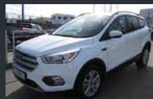
Kuga. Navigacija. Redna cena: 29.920. Akcija: 20.990.

Veit team d.o.o., Čufarjeva ul. 24, Vir, Domžale / T: 031 395 395 / www.veitteam.si