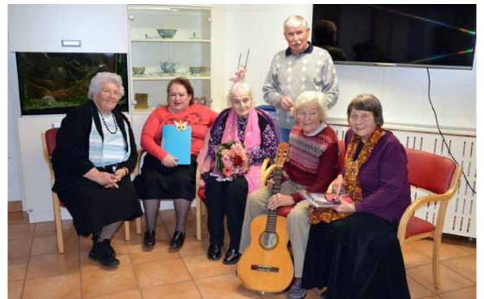
Rad pomaga tudi odličnim trzinskim recitatorkam.

Zaradi vodstvenih in mnogih drugih sposobnosti so ga občani pritegnili tudi v politične vode. V svojih vrstah ga je želela Lista za trajnostni razvoj Trzina, in tako je dve leti deloval tudi kot občinski svetnik, tudi takrat pa je ohranil položaj poveljnika civilne zaščite.