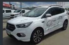
Kuga. 4X4. Radarski tempomat. Redna cena: 42.990. Akcija: 31.490.