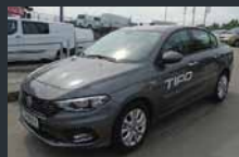
Tipo. Limuzina. Svetla notranjost.