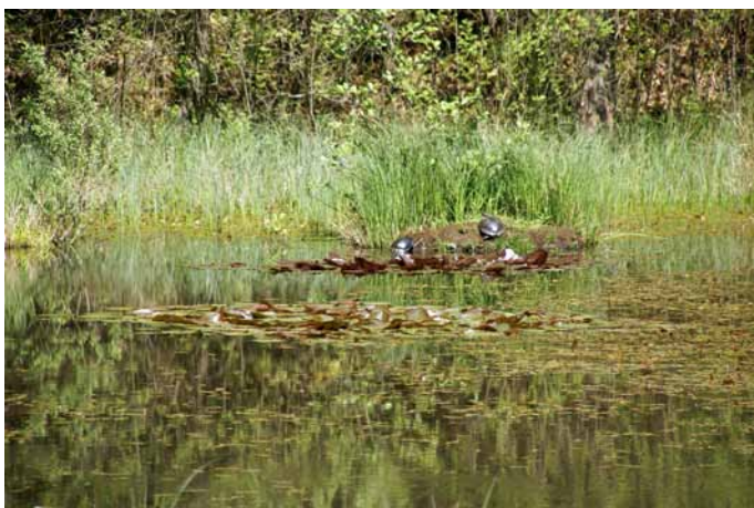
Trzinsko mokrišče v vsej svoji naravni lepoti

Evropski kmetijski sklad za razvoj podeželja: Evropa investira v podeželje