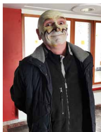
Pustni duh je preplaval tudi odrasle.