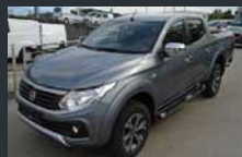
Fullback. 4x4. Pick-up. Možen poračun DDV.