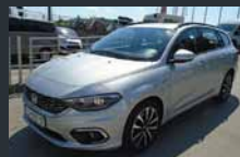
Tipo karavan. 1.3 dizel. Velik prtlačnik.