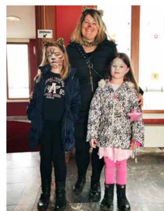
Prisrčne in nagajive družinske maske