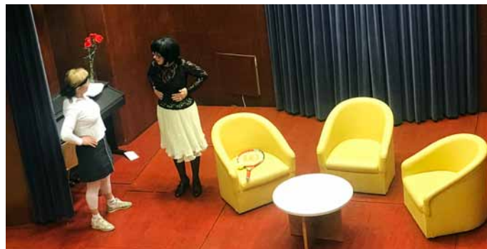
Dolenjka in Gorenjka med duhovitim nastopom s temo žensko-moški odnosi

Sledil je duhovit prizor iz življenja Dolenjke in Gorenjke, ki sta obiskovalcem med drugim predstavili svoja pričakovanja glede dneva žena, pa glasbeni užitki, za katere je poskrbel moški pevski zbor Radomlje, nato pa se je cela dvorana zavrtela v ritmičnih plesnih glasbah. Ob koncu uradnega dela večera je bila odprta še razstava ročnih del vezilj v preddverju Centra Ivana Hribarja. Ogleдали smo si jo po