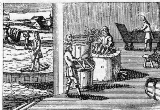
Slika 5. Barvarna (vse slike reprodukcije iz Francisci Philippi Florini Oeconomus prudens et legalis ... 1702, knj. 6)

Iz propadlega Čebulovega obrata je njegov bivši mojster Zanetti kupil nekaj stavev in že v novembru 1754 pričel, skoraj gotovo na svojem domu, s proizvodnjo svilenih tkanin. Zanetti je torej primer manufakturista, ki se je povzpел od mezdneга delavca (mojstra) do samostojnega — čeprav zelo skromnega — lastnika proizvodjalnih sredstev. Toda sčasoma je zaradi že opisanih zunanjih okoliščin zdrknil na stopnjo svilarskega tkalca. Do vključno l. 1761 je delal sam z ženo in štirimi delavci; od