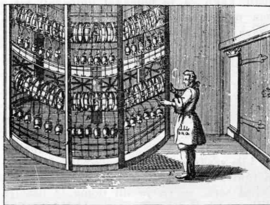
Slika 3. Veliki kolovrat (machina ali ital. filatorio)