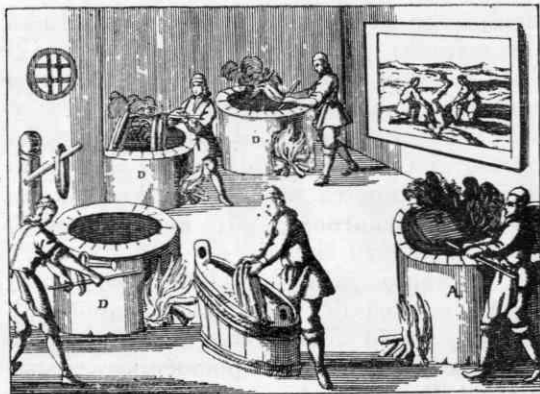
Slika 4. Barvarna

Čebul se je razvijal še dalje in mogel je storiti četrti važni korak: leta 1738 je že imel 20 statev, 4 pa je nameraval še dokupiti. Kolikor ni imel gotovine sam, si jo je izposojal pri raznih upnikih, ne da bi pri tem slutil, da ga bo to pokopalo. Da bi zavaroval celotno premoženje, vloženi kapital in dobiček, je končno le prosil za podelitev privatnega privilegija. Dobil ga je, kajti Tabouret je bil na tleh, čeprav mu je privilegij pravno še vedno veljal. S kosom papirja si Francoz že res ni mogel nič več pomagati, zanj so bile to le še mrtve