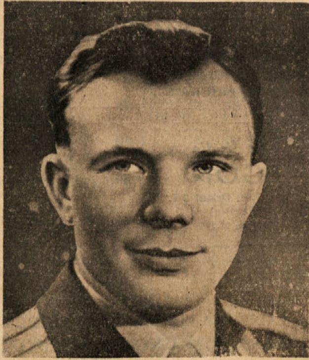
JURIJ ALEKSEJEVIČ GAGARIN

Tovariš Gagarin je to poudaril takoj zatem, ko je po povratku iz vesolja stopil na Zemljo. Njegova prva misel je bila: poslati pozdrav Komunistični partiji in vladi Sovjetske zveze. Toda partija in vlada nista odgovorila na to v tonu, ki bi poveličeval moč svoje države temveč v tonu, ki naglašala skupno potrebo vsega