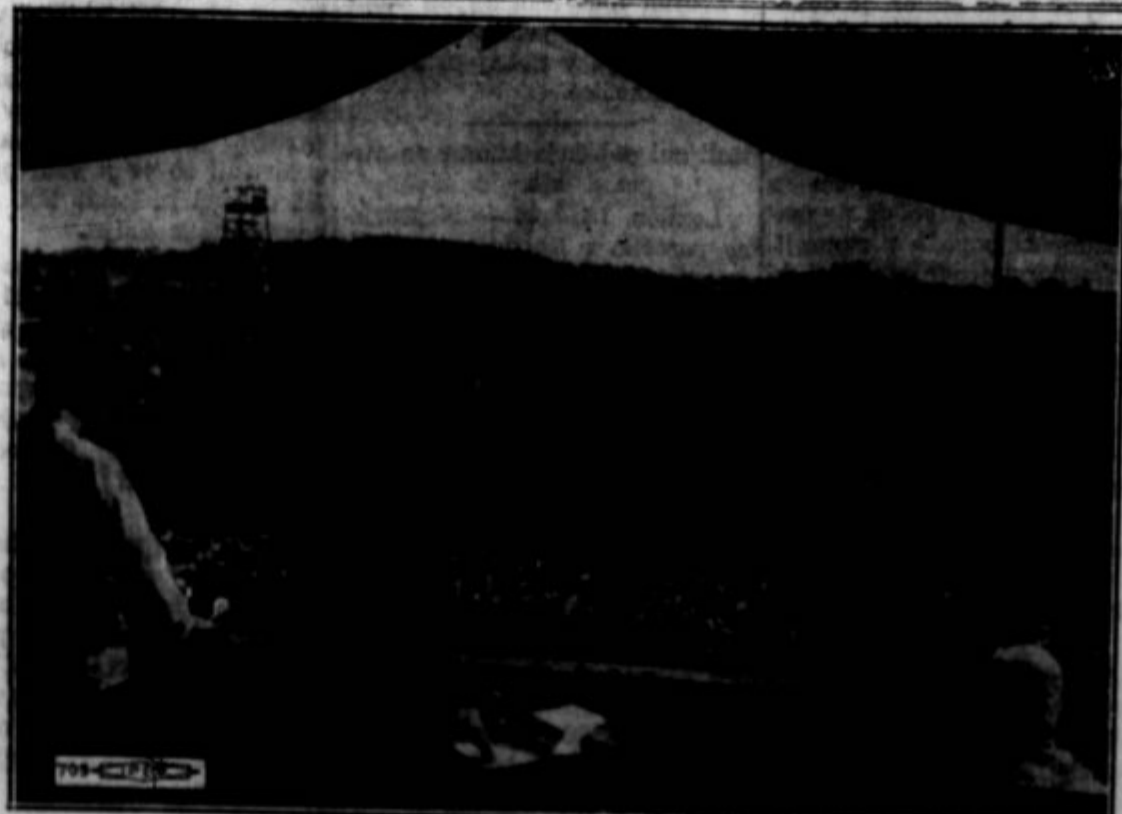
Tekstilni delavci v sovjetski Rusiji se zabavajo po končanem delu s sportnimi igrami.

Tudi avtne unije Amerilavske federacije so v takvenja in prelivanja. Nemnost proti avtnemu delavskemu odboru stopnja narasla, dikačnejši elementi tabi naj unije odbor ignorirajo dijo vzgledu delavcev pri Products družbi, kjer so stvari v svoje roke, delišanje in priznanje tovarn odborov unije. S slične metode, ki skušajo komunisti svojo zmago v Washingtonu Avtni delavci pravijo, da priznanje unije in proti njajstvu ni bil izgubljen, se le začasno napeljan v kolovoz.