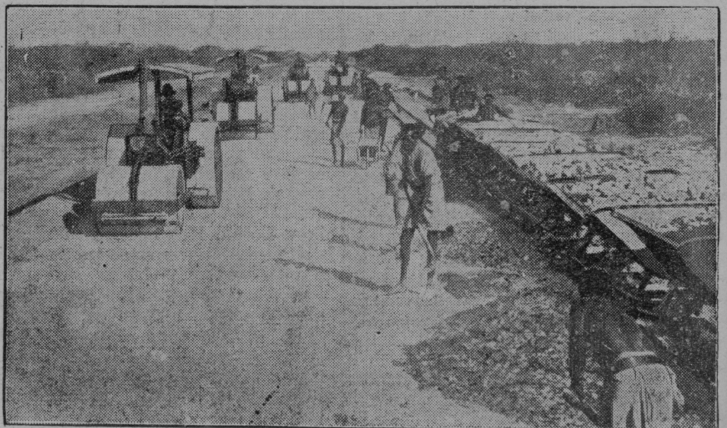
Italijani gradijo in valjajo z motornimi valjarji nove ceste v zasedenem abesinskem ozemlju.