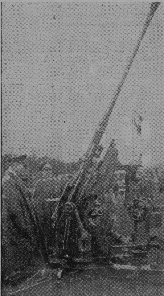
Najnovejši proliletalski top v Nemčiji.