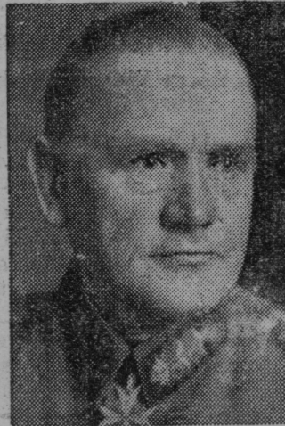
Nemški vojni minister von Blomberg je bil imenovan za feldmaršala.