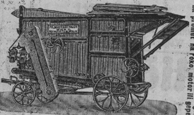
Mašine za mlaiti s patent Rolten-Ringschlagler za promet na foku, motor ili gopel

„Gopel-Werke“ za živino: mlini za čiščenje žitja, trijerji, rebler za koruzo: MAŠINE za REZANJE KRME, (Patent Rolten-Ringschlagler) gre najbolje. BEZ za repo in „srot“. Aparat za oparjanje krme, peči s štedilnim kotlom, PUMPE za gnojnice, ki se vrtijo in vse druge poljedelske mašine.