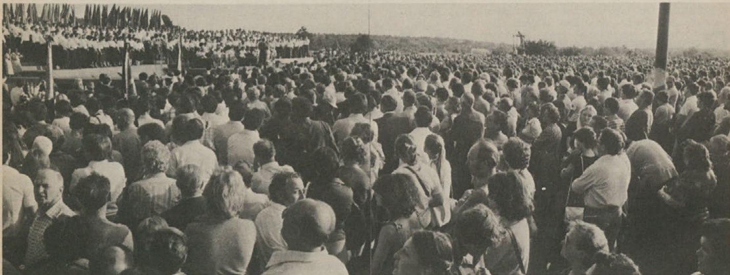
Množica, ki se je zbrala na strelišču v Bazovici in počastila prve borce za narodno svobodo