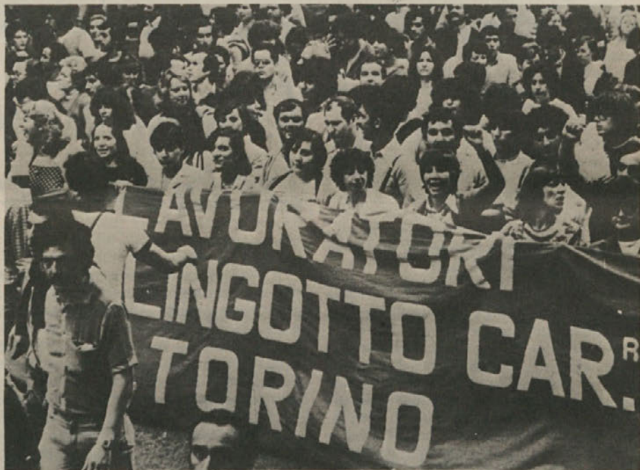
Turinski delavci stavkajo za svoja delovna mesta