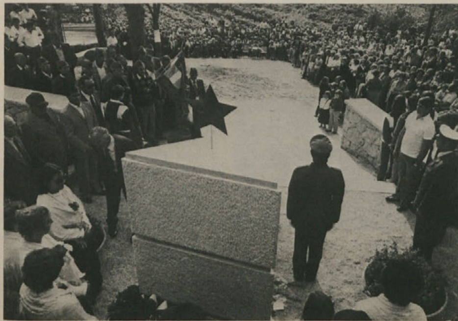
V Samatorci so domačini svečano odkrili spomenik padlim partizanom. To nedeljo bo podobna svečanost tudi v Jamljah.