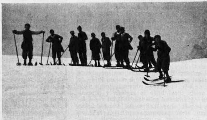
Križanska DMK v Ljubljani: Smučarji