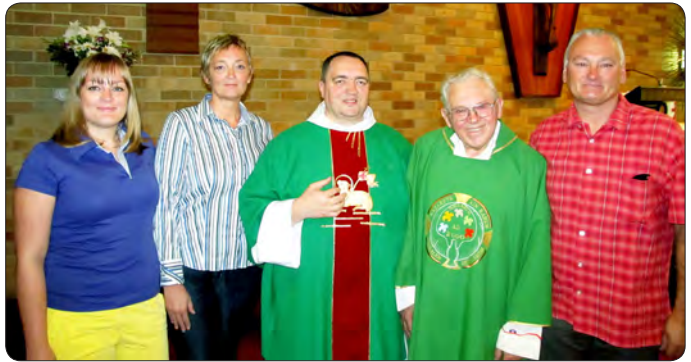
Po sv. maši, 18.11.2012:

"Sedanje življenje je veliki povodnji podobno, v kateri plavamo iz časnosti v večnost. - En sam čolnič je, čolnič svete krščanske vere, ki nas pelje skozi srdite valove pregrešnih skušnjav, katere nas hočejo zakriti. - Kolikorkrat mi v greh pademo, tolikorkrat čolnič zveličanja svojega zdrobimo. - Le ena deska zveličanja nam še ostane, tiste se moramo zvesto držati, ako hočemo oteti svojo dušo večnemu pogubljenju. Le-ta deska je prava resnična pokora, katero nam sv. Janez Krstnik v puščavi kaže ino