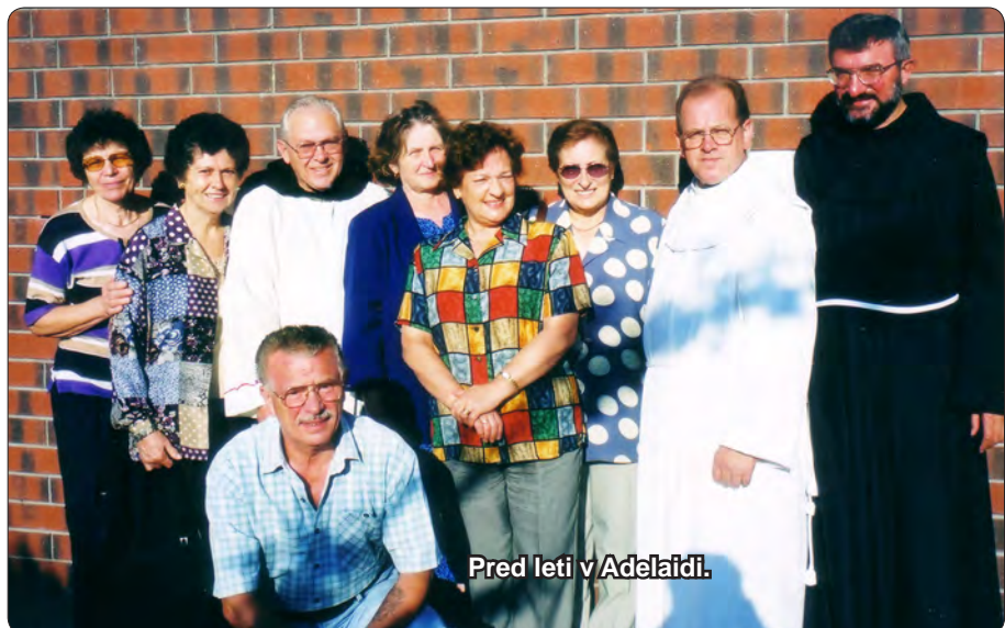
Pred leti v Adelaidi.