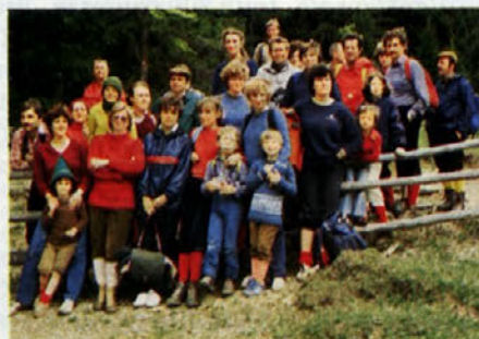
Posnetek za spomin

Kljub veliki udeležbi je deževno jutro marsikoga zadržalo v topli postelji. Dež nas je spremljal samo do Kranja. Peljali smo se do Planine pod Golico, naprej pa smo se odpravili peš. Izbrali smo najpolačnejšo pot. Po enourni hoji so se zaslišali kliči v sili: Mamica, lačen, žejen! Tudi nam odraslim je bil ta klic kar všeč. Bazni tabor smo postavili na prvi planšariji. Kako je bil postanek potreben, se je pokazalo, ko smo se vsi postavljali na glavo v nahrbtnike. Še posnetek za spomin in nadaljevali smo pot do lovske kočice, kjer smo pustili nahrbtnike in se odpravili na sam vrh, od koder je bil čudovit razgled na Dravsko dolino na Vrbsko jezero. Vpisali smo se v spominsko knjigo in se