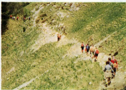
Pot proti lovski koči

Golica je 1935 m visok vrh v Karavankah. Znana je po poljanah snežno belih narcis, ki se razcvetijo v drugi polovici maja. Ker Cinkarnarji Golice že nekaj pomladi nismo obiskali, smo se za ta izlet odločili letos. Izlet je bil enodneven, pot pa manj zahtevna, zato so se tega izleta udeležile tudi družine s planinci - cicibani.