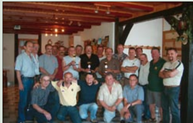
OZVVS Bela Krajina organizirala tekmovanje v streljanju s pištolo - udeleženci tekmovanja.