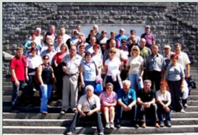
Udeleženci ekskurzije OZVVS Mežiška dolina, ki so obiskali Posočje

Sredi avgusta smo se veterani iz Mežiške doline odpravili na ekskurzijo v Posočje. Zgodaj zjutraj smo se v deževnem vremenu z avtobusom odpravili na pot, ki nas je vodila mimo Ljubljane proti Kranjski Gori in od tam čez Vršič, kjer smo imeli krajši postanek, in se pre-mraženi po serpentinah varno spustili v dolino Soče, kjer pa nas je