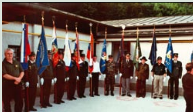
Svečana otvoritev obnovljenih prostorov strelišča z zračno puško v Štorah

Tretji september 2008 je bil za strelstvo v Štorah izjemno pomemben datum. Šestdeseta obletnica strelstva je visok in pomemben jubilej in si vsekakor zasluži spoštovanje. Bogata tradicija strelstva v Štorah sega že v čas pred drugo svetovno vojno. O tej bogati dejavnosti go- vorijo številna priznanja, ki krasijo steno v notranjosti strelišča.