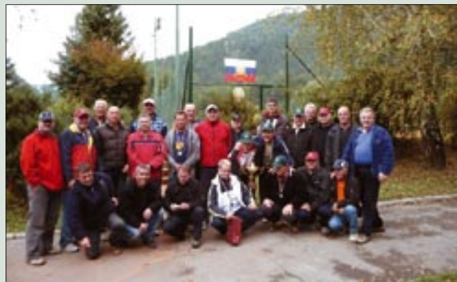
Udeleženci 9. teniškega prvenstva dvojic ZVVS v Hrastniku.