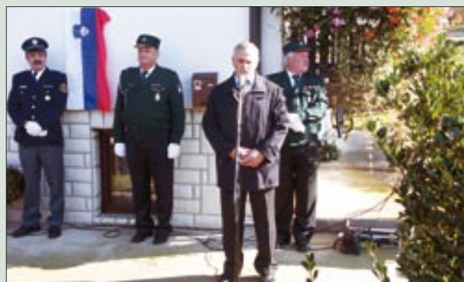
Odkritje spominske plošče v Laškem

Oddaji orožja so se uprle nekatere občine, 16 njih, žal Laške, zaradi različnih okoliščin, tako družbenih (zaradi menjave lokalne oblasti), kot mnogih, za naše okolje posebnih, ni bilo med njimi. Orožje