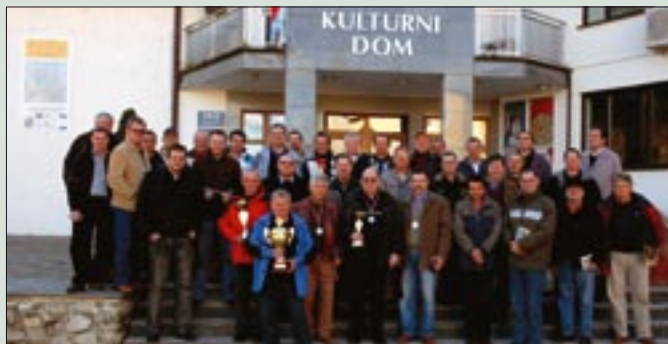
Udeleženci prvega šahovskega turnirja, ki sta ga organizirala OZVVS Šmarje pri Jelšah in ZVVS