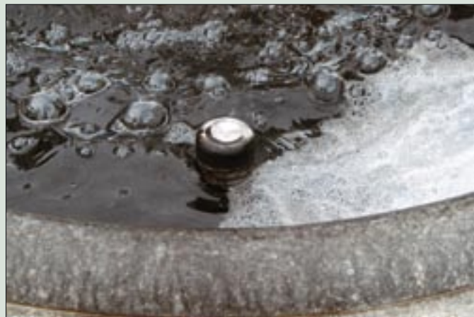
Črna voda, pene in plast mastnih saj – podoba fontane pred kočevskim spomenikom osamosvojitve 2. oktobra 2008

V lanskem decembru je podstavljeno eksplozivno telo povsem uničilo kamnito ploščo pomnika v Mozlju, letos pa je z garaže Mihaela Vreska pri Kočevskem jezeru, kjer je bilo v obdobju 1990/91 tajno skladišče orožja, medtem že identificirana oseba odtrgala bronasto