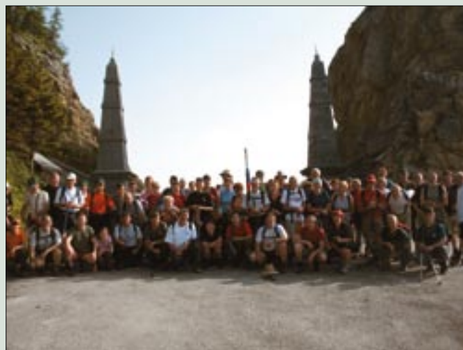
Udeleženci 8. pohoda po poteh TO

Območno združenje veteranov vojne za Slovenijo Tržič je v počastitev 25. junija, dneva državnosti, in ohranjanja spomina na Teritorialno obrambo in njene pripadnike, ki so bili v letu 1991 med nosilci oboroženega odpora, organiziralo že osmi pohod po poteh TO.