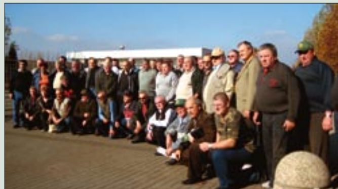
Brežiški veterani ob pokopališču Ovčara

Ekskurzija brežiških veteranov pa je bila namenjena predvsem obisku Vukovarja in njegove okolice, kjer je še vedno na vsakem koraku obilica sledi vojne. Res je po mestih in vaseh vse več rdečih streh, ki pričajo o novih gradnjah, zato pa je na drugi strani še več