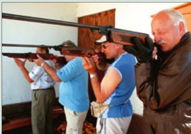
S tekmovanja v streljanju z zračno puško

Peto srečanje treh veteranskih združenj Spodnje Savinjske doline je bilo letos v občini Braslovče. Ob tej priložnosti so se veterani vojne za Slovenijo – Območno združenje veteranov za Spodnjo Savinjsko dolino Žalec, veterani društva Sever, člani Združenja borcev za vrednote narodnoosvobodilne vojne in Slovenska vojska zbrali pri Osnovni šoli Braslovče, kjer so druženje popestrili s športnimi igrami.