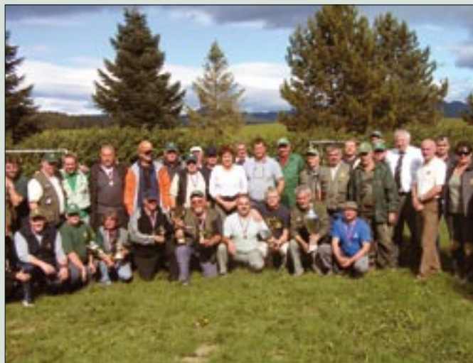
Udeleženci 1. tekmovanja v lovu rib s plovcem Šoštanj 2008