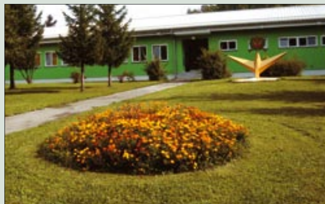
CVVS se ponaša z urejenimi cvetličnimi koriti, cvetličnimi gredicami in grmičevjem.