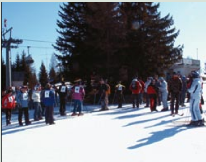
Tekmovalci pred startom na enem izmed prejšnjih prvenstev

Pred štirimi leti so se veterani vojne za Slovenijo iz severne Primorske prvič pomerili na svojem prvenstvu v veleslalomu. Prvenstvo je bilo kljub občasnim težavam zaradi pomanjkanja snega vselej dobro pripravljeno, kar dokazuje tudi dejstvo, da se je tekmovanja udeležilo vsako leto več veteranov iz vse Slovenije. Zato so se organizatorji odločili, da bodo naslednje prvenstvo, ko se začne tudi ciklus tekmovanj za nov prehodni pokal, preimenovali v prvenstvo veteranov vojne za Slovenijo v veleslalomu. Organizacijo prvenstva bo podprla tudi Zveza veteranov vojne za Slovenijo.