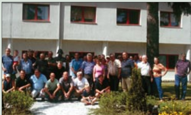
Veterani OZVVS Bela krajina obiskali Brigado zračne obrambe in letalstva v Cerkljah ob Krki.