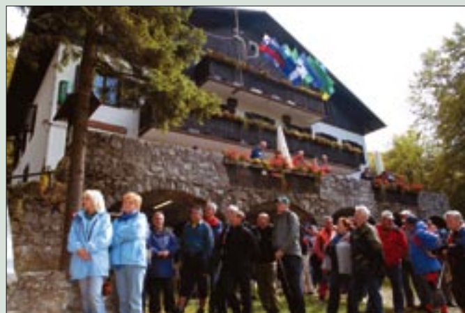
Z letošnjega srečanja na Mrzlici, ki se ga je kljub hladnemu vremenu udeležilo precej planincev in drugih pohodnikov z obeh strani doline

Mrzlica je bila konec septembra znova prizorišče tradicionalnega srečanja Zasavcev in Savinjanov. Med njimi je vsako leto tudi veliko članov območnih združenj veteranov vojne za Slovenijo z obeh strani hribovja. S temi srečanji se nadaljuje tradicija, ki ima svoje korenine v predvojnem delavskem gibanju, ko so si tu podajali roke revirski, libojski in zabukovski knapi, preboldski tekstilci, savinjski hmeljarji, libojski keramičarji in mnogi drugi ter krepili revolucionarno zavest Slovencev, ki se je še posebno pokazala med drugo svetovno vojno. Sicer pa lahko za začetek tovrst-