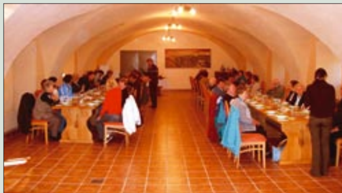
Štorski veterani obiskali Prekmurje

V soboto, 18. oktobra ob 8. uri smo se zbrali na postaji v Štorah, kjer nas je čakal avtobus Izletnik- Celje. Že kar na začetku se je videlo, da bo to izlet poln smeha in dobre volje. Naša prva postojanka je bilo Bukovniško jezero, znano po svojih energijskih točkah. Seveda smo si vsi želeli napolniti baterije s pozitivno energijo. Polni novih moči, smo se odpravili proti Lendavi. V Grajski kleti (na sliki) so nam pripravili degustacijo njihovih zelo dobrih vin in moški so strokovno ugotovili, da to popolnoma drži. Priznati pa moram, da