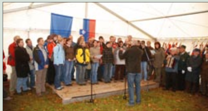
Del partizanske skupine Triglav ob spomeniku, posvečenem bitki na Čreti

Udeleženci slovesnosti, ki je tudi tokrat bila organizirana pod velikim šotorom, iz vrst članov ZZB, mladina, planinci, pripadniki drugih veteranskih organizacij, predstavniki občin in drugi zbrani so