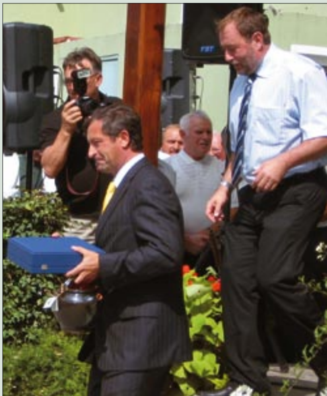
Slavnostni govornik na 17. srečanju veteranskih organizacij je bil tedanji minister za obrambo Karl Erjavec.

skrivanje prvega helikopterja Slovenske vojske, osvobodili so mejni prehod Pavličevo sedlo in karavlo Savinjski partizan v Logarski dolini.