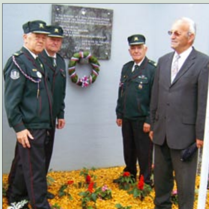
Odkritje spominske plošče na stavbi, v kateri je bil 73. Območni štab TO Ljutomer, postaja milice, občinski center zvez in občinski center za obveščanje in alarmiranje

Po daljši pripravi smo Ljutomerski veterani vojne za Slovenijo in Policijsko veteransko društvo SEVER za Pomurje organizirali odkritje