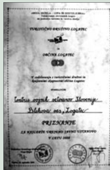
Centru vojnih veteranov sta Turistično društvo in Občina Logatec podelila posebno priznanje za ureditev in videz okolja.

Center vojnih veteranov deluje v kompleksu nekdanje vojašnice v Logatcu. Člani OZVVS Logatec, Zveza veteranov vojne za Slovenijo in Slovenska vojska, ki podpira delovanje centra, so v preteklih treh letih v propadajočo vojašnico vložili veliko truda in finančnih sredstev, opravljeno delo pa že kaže pozitivne rezultate. V centru se praktično vsakodnevno vrstijo najrazličnejše športne in družabne aktivnosti po veljstev in enot Slovenske