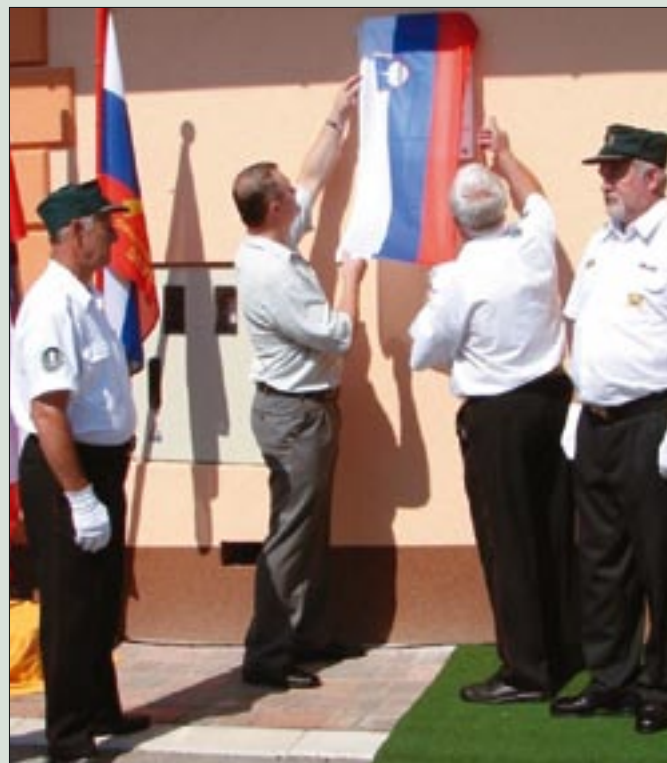
Veterani iz Sevnice odkrili spominsko obeležje na Pungerčarjevi zidanici na Malkovcu