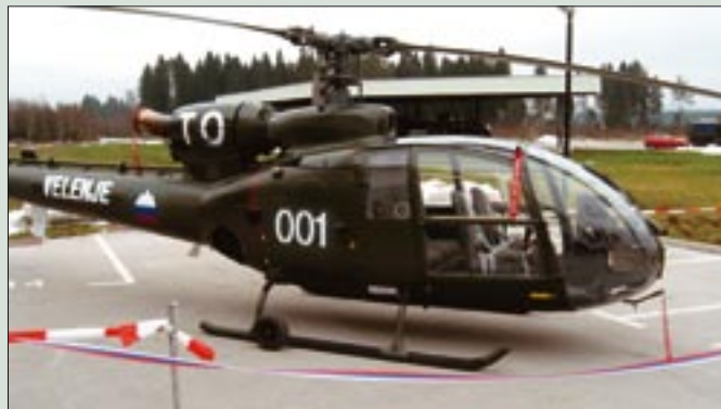
Prvemu plovilu TO Slovenije povrnili prvotne oznake

V četrtek, 4. 12. 2008, je bila v letalski bazi Slovenske vojske na Brniku krajša slovesnost, na kateri so predstavili prvo plovilo Teri-