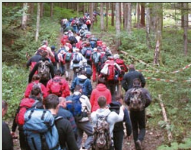
Kolona pohodnikov se vije proti Kamenemu zidu.

Tako kot vsako leto sta tudi letos OZVVS Kočevje in Planinsko društvo Kočevje pripravila zdaj že tradicionalni pohod na Goteniški Snežnik (1290 m). Pohod organizirata v spomin na javno postrojitev pripadnikov kasnejše 1. specialne brigade MORiS v Kočevski Reki 17. decembra 1990.