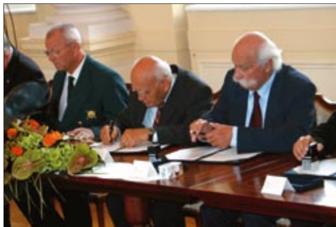
Podpis dogovora o medsebojnem sodelovanju in delovanju domoljubnih in veteranskih organizacij pri predsedniku RS dr. Danilu Türku.

V torek, 16. 9. 2008, smo pod pokroviteljstvom predsednika države dr. Danila Türka domoljubne in veteranske organizacije podpisale dogovor o medsebojnem sodelovanju in delovanju.