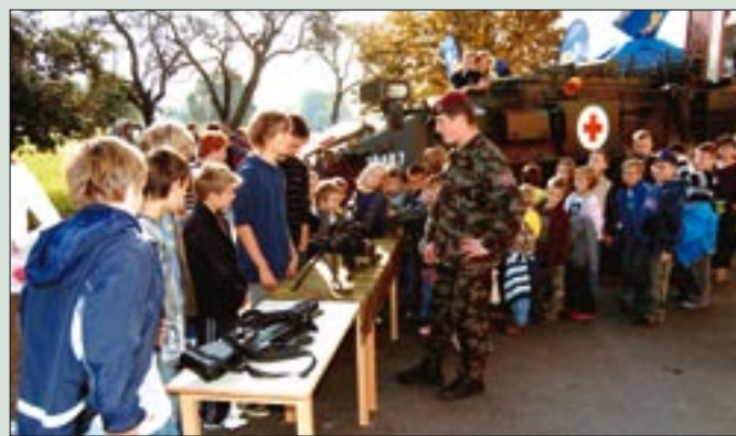
Učence in dijake sta zelo zanimala helikopter in pehotno orožje.