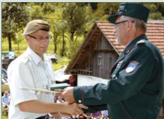
Predstavnikom Slovenske vojske in policijskemu združenju Sever je predsednik OZVVS Velike Lašče podelil spominske plakete.

Osrednji dogodek našega delovanja in udejstvovanja v tem letu je bilo praznovanje 10. obletnice ustanovitve Območnega združenja veteranov vojne za Slovenijo Velike Lašče. Po uspešno izvedenem letnem zboru OZVVS Velike Lašče je postalo pred domom vetera- nov precej živahno in vladalo je slavnostno vzdušje. Z mnogo dela in truda nam je uspelo pripraviti lepo prireditvev ob našem praz-