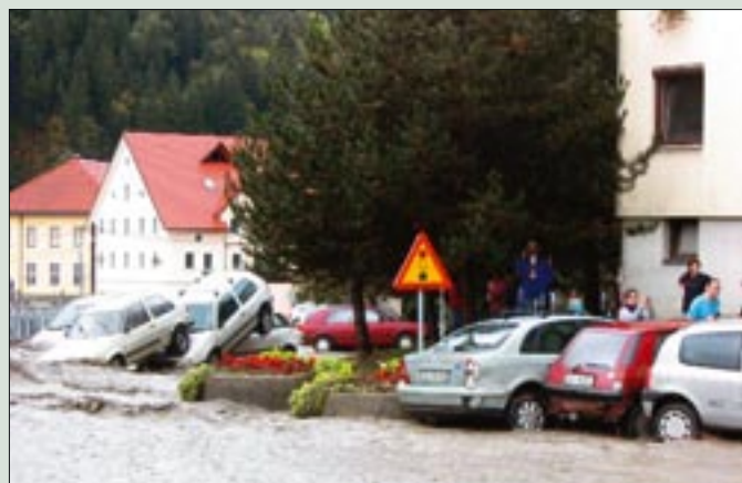
Pobesnena voda je odnašala vse pred seboj.

V tistih razmerah je bilo najpomembneje preprečiti vodnim gmotam nadaljnje pustošenje in reševati ogroženo premoženje. Ko so se vode umaknile nazaj v struge, pa prizadetim pomagati pri odpravi škode. Kot v drugih podobnih primerih so svojo pripravljenost pomagati ponovno izpričali številni prostovoljni gasilci. Brez njih si je težko predstavljati reševanje in prve sanacije po neurju. Prav tako se je v mnogih primerih izkazala sosedska pomoč. Številni sosede, prijatelji in znanci so zavihali rokave in prizadetim ponudili pomoč.