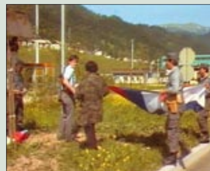
Izobešenje slovenske zastave 1. julija 1991 na mednarodnem mejnem prehodu Karavanke na Hrušici