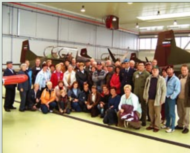
Konjiški veterani med letali Pilatus PC 9