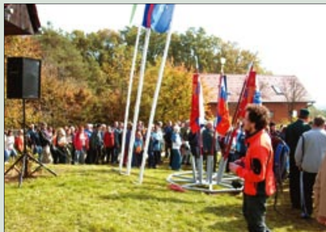
Udeleženci proslave so pohodnike sprejeli z navdušenjem in aplavzom