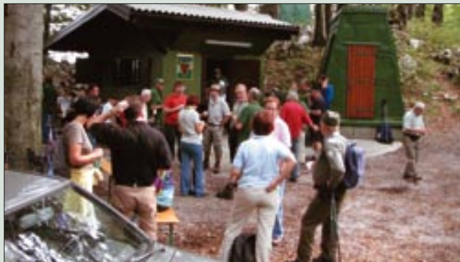
Udeleženci prvega pohoda Lokve 2008

Veteranke, veterani OZVVS Veteran Nova Gorica in njihovi družinski člani smo se ob odlični organizaciji Trnovsko-Banjške sekcije udeležili 1. pohoda Lokve 2008. Fantje se ne šaljijo in zatrjujejo, da bo postal tradicionalen.