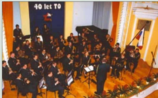
Koncert pihalnega orkestra Slovenske vojske ob 40-letnici TO