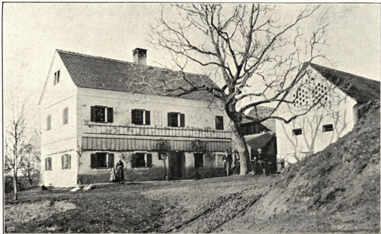
VRAZOV RODJENI DOM U CEROVCU.