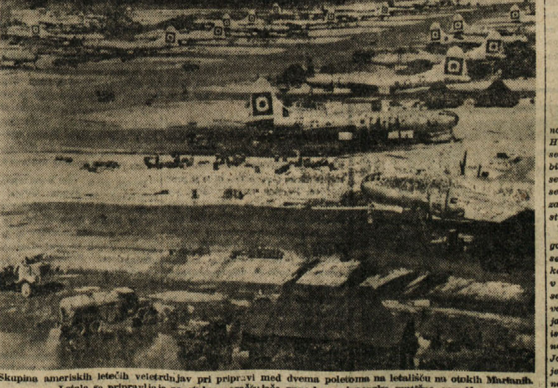
Skupina ameriških letelih veletrdnjav pri pripravi med dvema poletoma na letališču na otokih Marianih. Letala se pripravljajo za stalno naraščajoče napade na japonsko matično ozemlje.