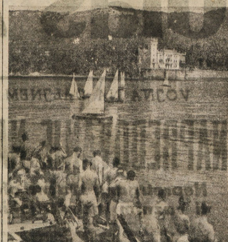
...pravijo angležiki in ameriški vojaki, ki prisostvujejo novozelandskim telman na morski planoti tržaškega zaliva, kateri čuvajo visine nad mestom in grad Miramare.