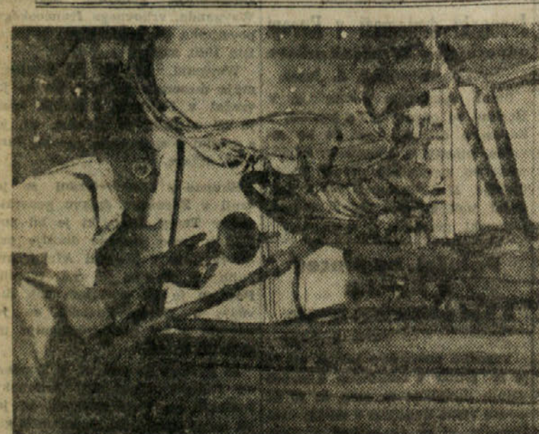
Slika nam kaže znanstvenika, ki pod zaščito maske in posebne obleke odstranjuje reči fosfor, ki je postal radioaktiven pod vplivom mečnih nevtronskih žarkov v napravi za razbijanje atomov.

II. Elektronski napovedujejo, da bo mogoe v kratkem nadzorovati dovajanje izmeničnega toka elektromotorjem in tako doseči pri njih najrazvitejšo hitrost in strogo nadzorstvo, kot je to danes že mogoe pri motorjih na istoimensi tok. Nekateri elektronski napravi, da bo na podlagi razvoja novih elektronskih cevij ter možnosti, ki jih je odprla izumljena radarja — naprave za ugotavljanje letal na velike razdalje — mogoe v bodočnosti brezlično prenašati elektriko, ener-