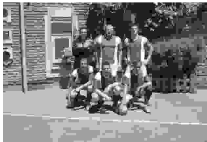
„Los Guada“, tretje mesto

vsem tistim, ki so sodelovali skozi ves turnir. Ne smemo pozabiti na navijače, ki so svojo ekipo venomer z vsemi močmi podpirali. Turnir je bil res lep in ostane želja, da se bomo prihodnje leto ponovno pomerili.