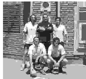
„Želva“, prvo mesto