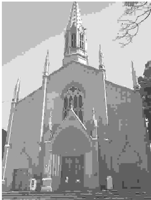
Pročelje cerkve San Vicente Ferrer