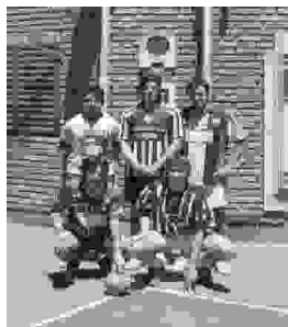
„Patula“, drugo mesto

Pokale smo razdelili med praznovanjem mladinskega dne. Občinstvo je zaploskalo zmagovalcem in