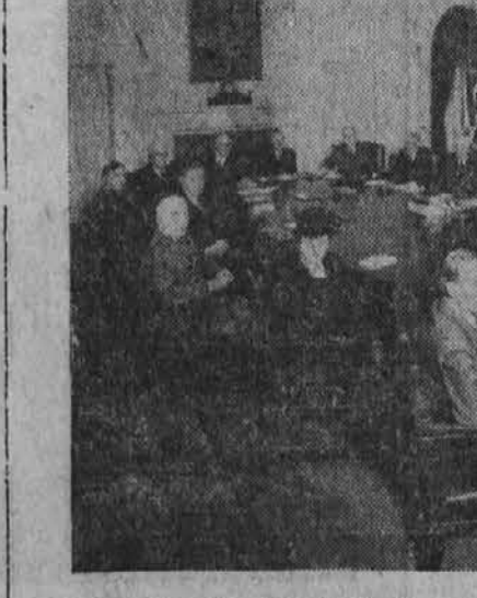
Gornja slika predstavlja sejo vojnega kabineta, kateri načeljuje predsednik Roosevelt.

Predsednik Roosevelt s svojim vojnim kabinetom