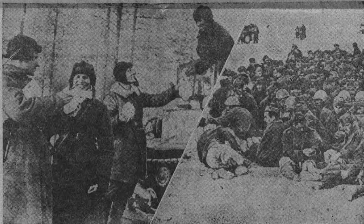
Na sliki na levi vidimo smehljajoče se in dobro oblečene ruske vojake, člane tankovskega zborja, ki so se v svojem prodiranju za Nemci za hip ustavili, da se naučijo svežega zraka in da použijejo svoje kosilo. Na desni pa so italijanski vojni ujetniki v Libiji, ki počivajo na svojem potu v angleško ujetništvo.