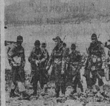
Gornja slika prikazuje ameriško vojaštvo v Alaski, naši najsevernejši posesti.

Predsednik Roosevelt s svojim vojnim kabinetom