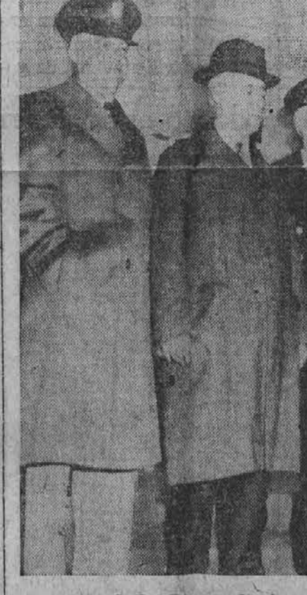
Predsednik Roosevelt in premier Churchill sta sklicala prvo posvetovanje vojnega sveta v Beli hiši. Na gornji sliki so ameriški člani tega sveta. Od leve na desno so: general H. H. Arnold, načelnik armadnega letalskega zbora; vojni tajnik Stimson; admiral H. R. Stark, načelnik pomorskih operacij; mornariški tajnik Knox in general G. C. Marshall, šef ameriškega generalnega štaba.