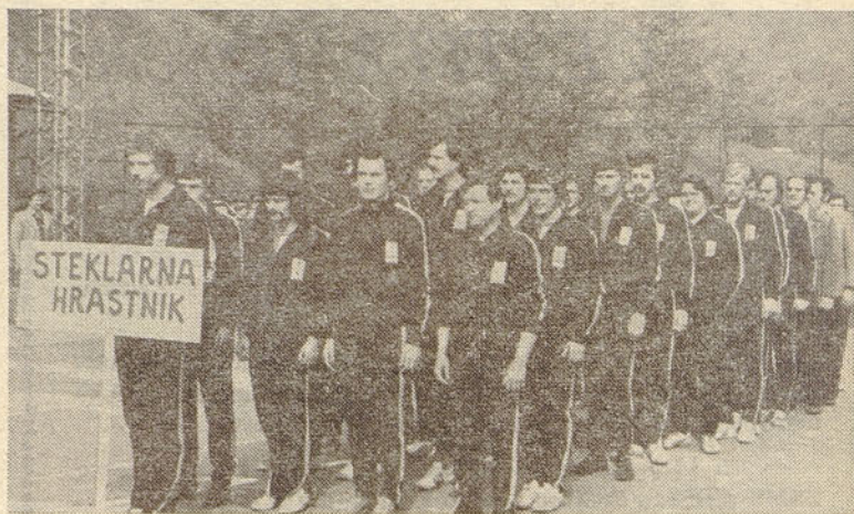
Naši športniki na peteroboju — otvoritev iger