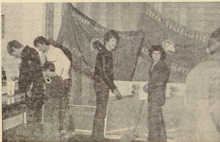
Na razstavi o mladinskih delovnih akcijah je bilo vedno dovolj obiskovalcev

Kako obsežno delo bo to, lahko povedo že same številke: okrog 24 tisoč brigadirjev, razvrščenih v