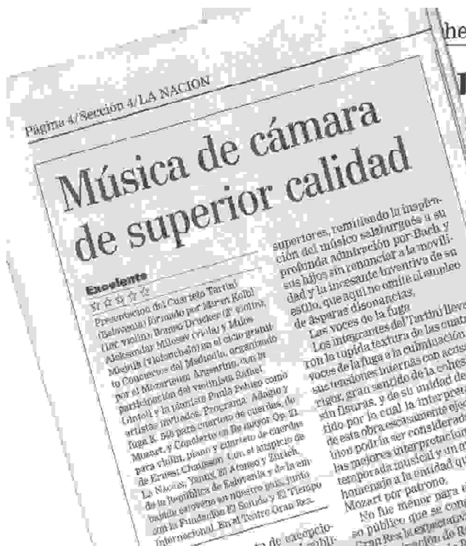
Pohvalni odmevi ob nastupu kvarteta Tartini v dnevniku „La Nación“

D-ova za tiskovni referat Zedinjene Slovenije