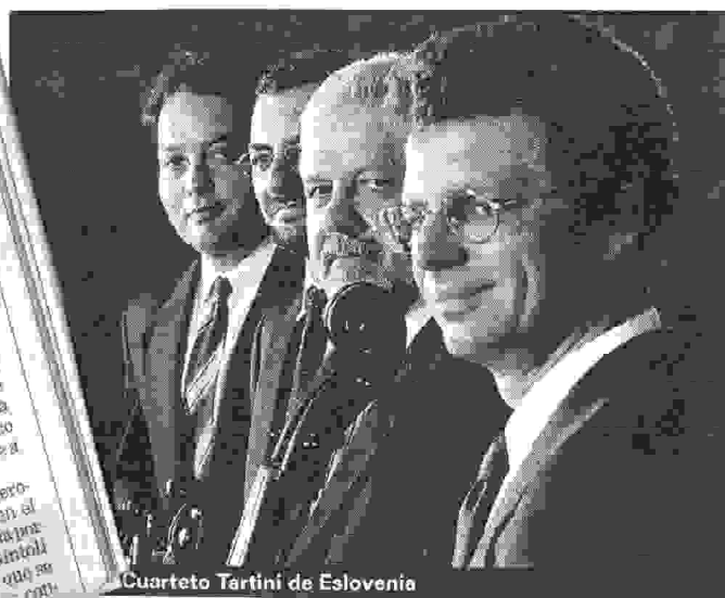
Cuarteto Tartini de Eslovenia