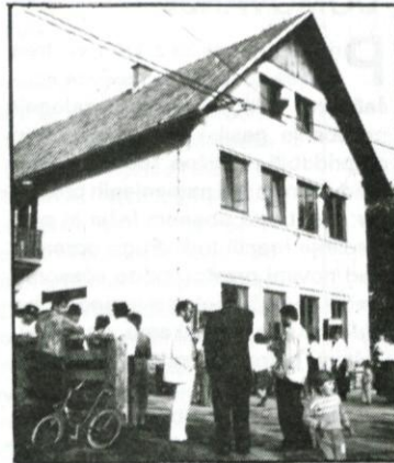
Pogled na obnovljeno šolo od zunaj

Vse polno ljudi se je nabralo 11. septembra letos v Žibršah, ko je bilo vse nared, da se odpro vrata obnovljene šole na Planinah. Obnovitev je zajela hidroizolacijo zidov, zamenjavo dotrajanih oken in vrat, zamenjavo električne napeljave, vgraditev napeljave za centralno ogrevanje, obnovo ometov in razna drobna dela - vse za več kot 800.000 dinarjev. Polovico potrebnega denarja je zagotovila občina iz amortizacije, drugo polovico so darovala podjetja, obrtniki in posamezno še mnogo kdo, pri čemer velja še posebej pohvaliti zajetne delovne prispevke domačinov.