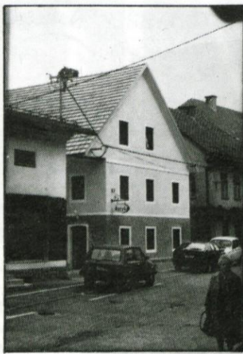
Obnovljena Mačkova hiša

Če bo šlo vse po sreči, bo zgradba nared za otvoritev v začetku oktobra. Jago