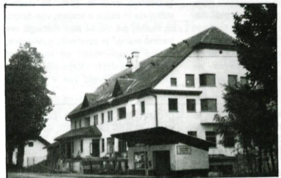
Poslovna in stanovanjska zgradba septembra 1991