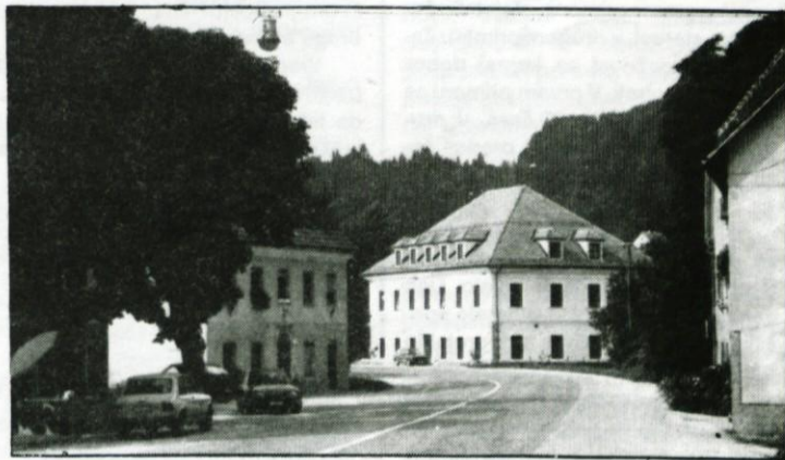
Zunaj kot nekoč, znotraj drugačna: ljudska šola Gor. Logatec