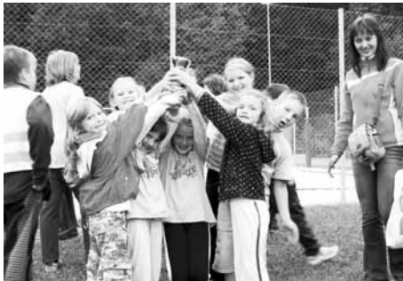
Veselje ob prejemu pokalu

PGD Mengeš I., PGD Topole, PGD Loka I., PGD Mengeš II., PGD Loka II.