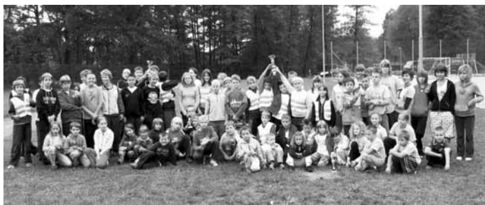
Mladi tekmovalci po razglasitvi rezultatov

Starejše gasilke in gasilci so tekmovali v vaji s hidrantom in raznoterostih, končne uvrstitve pa so bile: