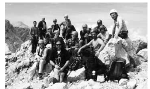
Skupaj na vrhu Križa letos poleti.