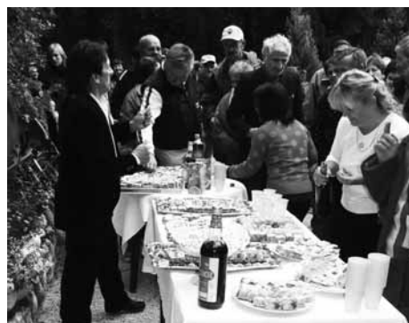
Bogato obložene mize pri Fartkovih