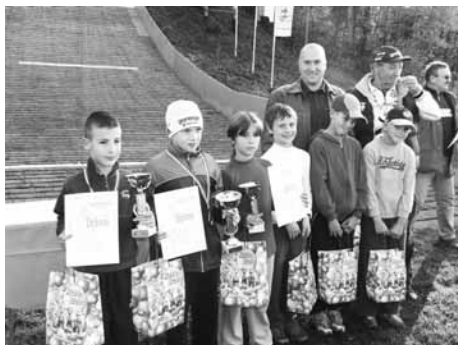
Podelitev medalj – državno prvenstvo, dečki do 10 let