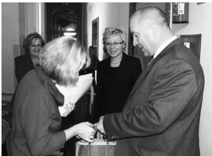
Župan je s seboj prinesel tudi darilo.