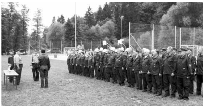
Predaja raporta pred razglasitvijo rezultatov v kategoriji starejših gasilk in gasilcev