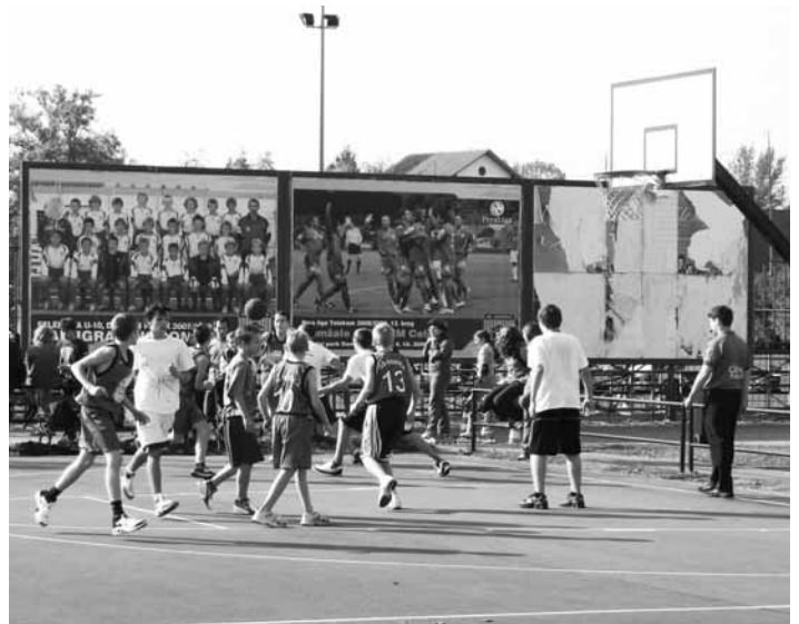
S športom proti zasvojenosti