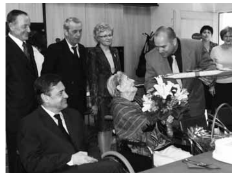
Slavljenska je prejela čestitke in darila.