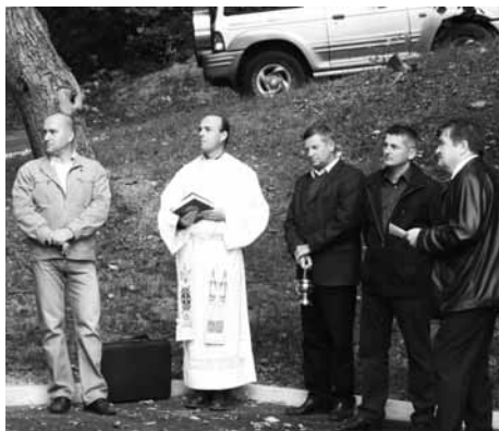
Otvoritev in blagoslovitev nove ceste