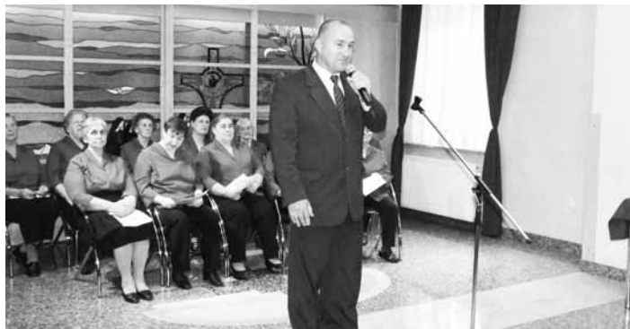
Pozdravni nagovor župana