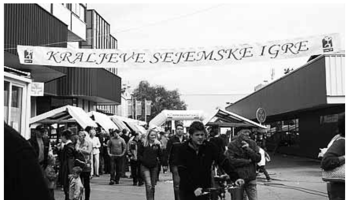
Na stojnicah so obiskovalci lahko kupili marsikaj zanimivega