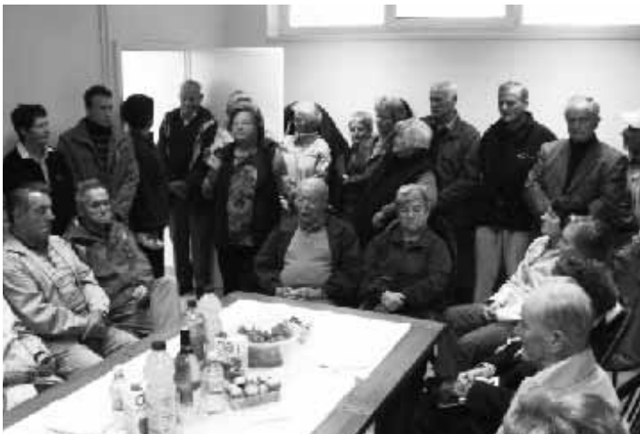
Starejši občani se bodo odslej zbirali vsaj enkrat tedensko