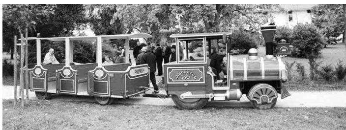
Vsi udeleženci prve otvoritvene vožnje