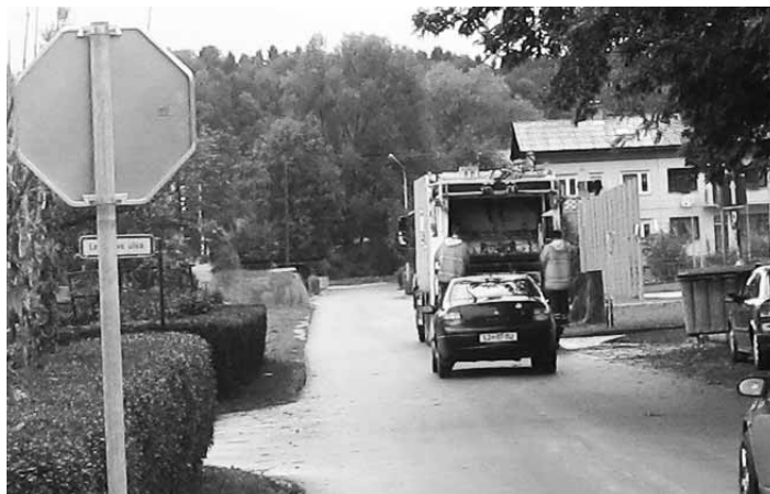
PRODNIK d.o.o. iz ekološkega otoka stresa vse na en tovornjak, ki pobira smeti!?