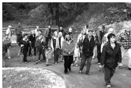
Po novo odprti ceste se je sprehodilo veliko število občanov in občank.