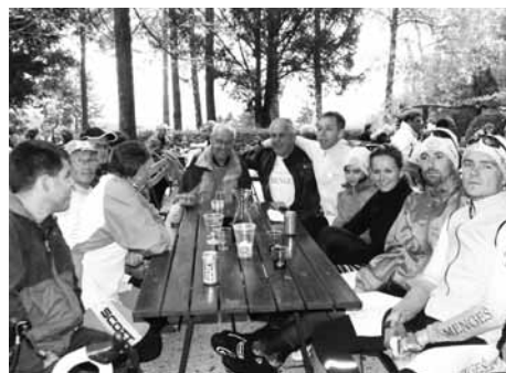
Veselo razpoloženje na Mengeški kočji