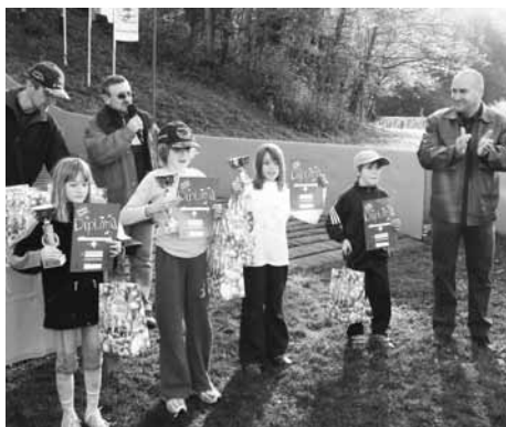
Podelitev medalj – deklice do 11 let, pokal Cockta