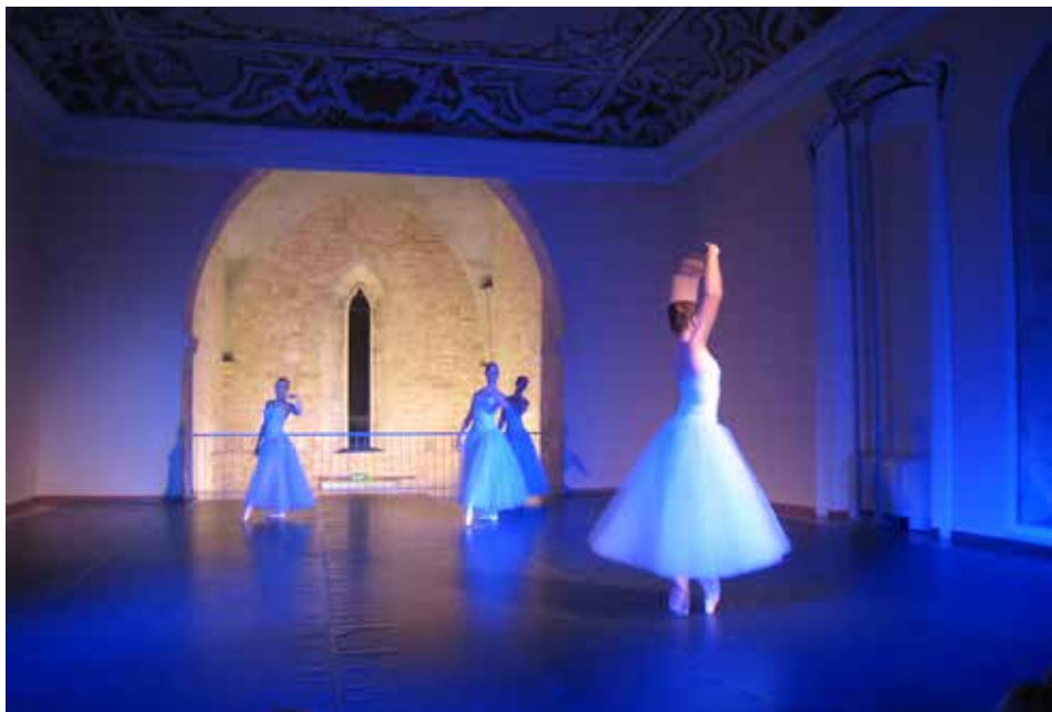
Balet v Istarski sabornici