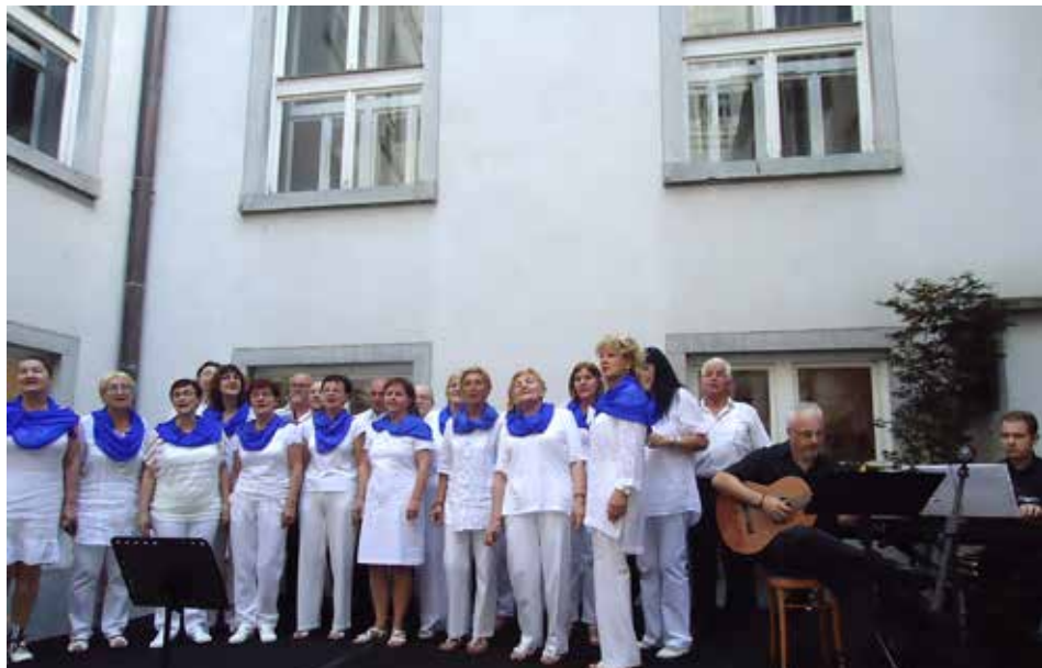
Zbor Encijan na otvoritvi razstave v NUK-u

Slovenske akademije znanosti in umetnosti iz Ljubljane ter Združenja slovenske izseljenske matice. Prav ta povezava nas še posebej veseli.