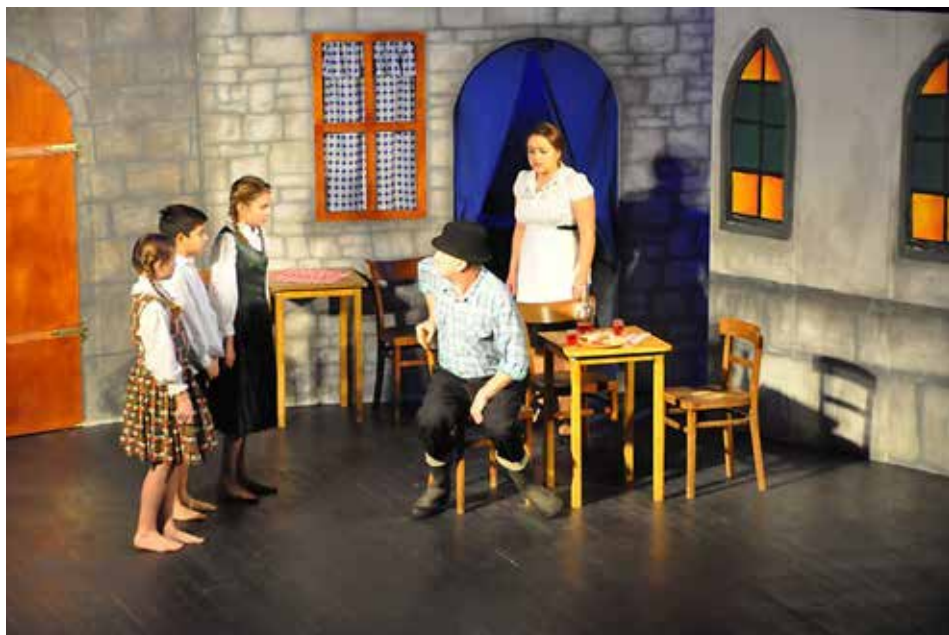
Predstava Tistega lepega dne

starejše društvo Istra Pulj, postopoma pa so se pridružila še druga, tako da so v lanskem letu sodelovala vsa, kar je odraz njihovega dobrega sodelovanja v sklopu Koordinacije istrskih slovenskih društev. Skupni plakat je vabil na pestre prireditve: literarne večere, razstave, koncerte ter filmske, gledališke in baletne predstave, in to ne le člane društev, ampak vse sokrajane in druge goste. Vsem smo želeli približati vsaj delček slovenske kulture, na katero smo pripadniki slovenske manjšine na Hrvaškem tako zelo ponosni. SKD Ajda Umag je letos v goste povabilo tudi odlično gledališko skupino iz Leskovca, domača Vokalna skupina pa je nastopila tudi na prireditvi v Buzetu.