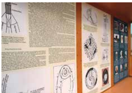
Razstava Noordungovih načrtov

pri uvrščanju gostujočih ustvarjalcev v skupne programe morali podrediti finančnim omejitvam. Kljub temu ugotavljamo, da smo publiki ponudili pester program. Pri tem naj poudarimo, da so tudi gostujoči umetniki izkazali veliko razumevanja pri izpolnjevanju zastavljenega programa.