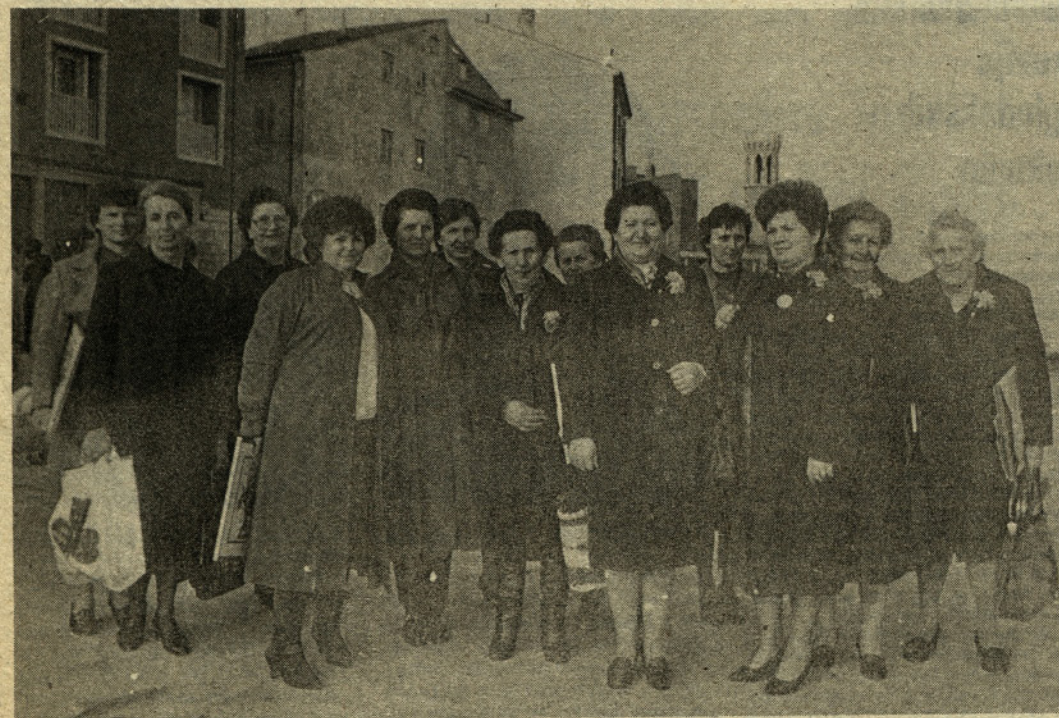
Udeleženke izleta iz žalske občine