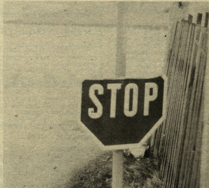
Seveda tale primer polomljenega prometnega znaka v prometnem križišču v Dolenji vasi pri Preboldu ni edini. Takšnih bi lahko našli še več. Tudi tokrat ni o krivcu nič znanega. Lahko se le hudujemo nad neodgovornim občanom, ki je s takšnim početjem spravil v vsakodnevno nevarnost številne udeležence prometa.