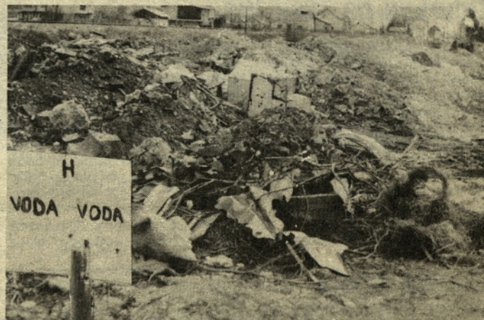
Lani v tem času smo opozorili na odlagališče odpadkov ob železniški progi v bližini gostišča Orešnik na Polzeli. Tedaj so nam predstavniki krajevne skupnosti obljubili, da bodo v najkrajšem času odpadke zasuli, obljubo pa so dali tudi kranjom, ki jih to odlagališče moti. Pa ne gre samo zato, tudi na posnetku je videti, da je tu hidrant za pitno vodo, a možnostih zastupitve pa ne kaže izgubljati besed. Zato krajevni skupnosti Polzela ponovno postavljamo vprašanje, kdaj bo to odlagališče sanirano. jk