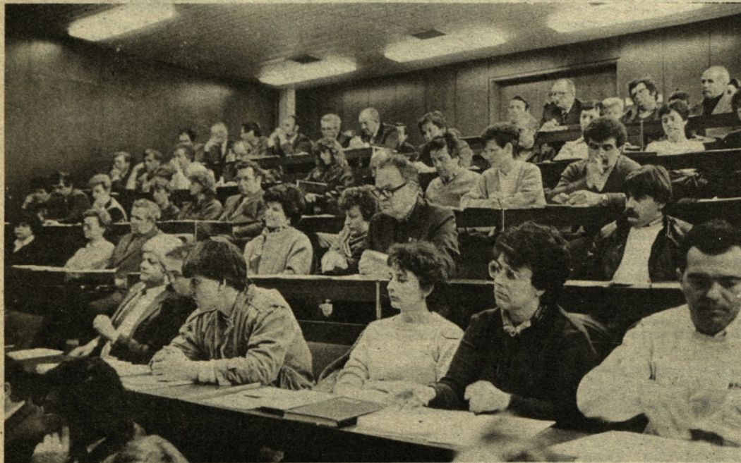
Delegati zborov občinske skupščine so soglasno izvolili vodstvo in organe občinske skupščine