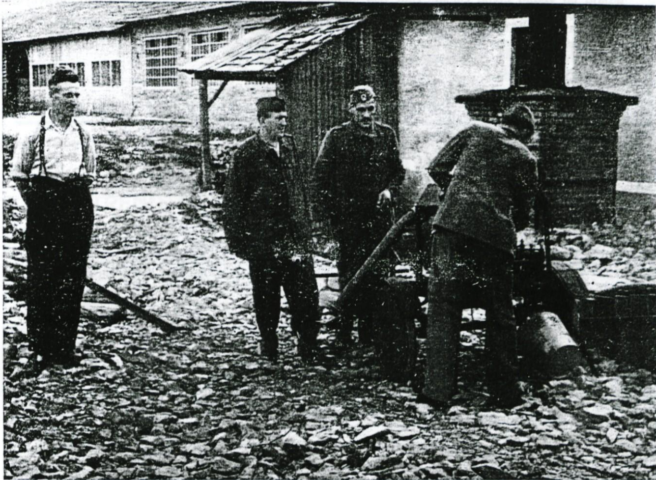
NAŠI GASILCI PRI PREIZKUŠANJU ORODJA

opreme bi bila naša ekipa tehnično zadovoljivo opremljena. Seveda pa to ni vse. Na prikladnih in za požar nevarnih krajih po obratih morajo biti sodi vedno napolnjeni z vodo, poleg njih pa stalno nameščena vedra za ročno gašenje. Na »Minimaxe« tudi ne smemo pozabiti. Zaenkrat jih je razvrščenih po tovarni v zadostnem številu, vendar jih je potrebno občasno kontrolirati. Tudi ostalo gasilno orodje, kot n. pr. kavlji, lestve, krampi itd., morajo biti na določenih mestih.