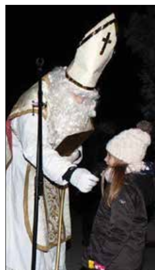
Miklavža so v goste povabili tudi člani Turističnega društva Rečica ob Savinji.

Letošnje srečanje z Miklavžem bo še bolj pisano in veselo, saj bodo poleg bogatega programa, ki ga bodo izvedli učenci Osnovne šole Rečica ob Savinji, poskrbeli še za praznični prižig lučk na rečiškem trgu. Proti koncu meseca,