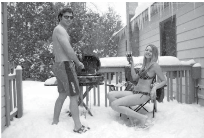
Ah, zdaj smo že navajeni. To sta naša soseda iz Rusije.

Rečičan: „Saj imam nova očala, da lahko vidim lepe ženske plesati in telovaditi.“