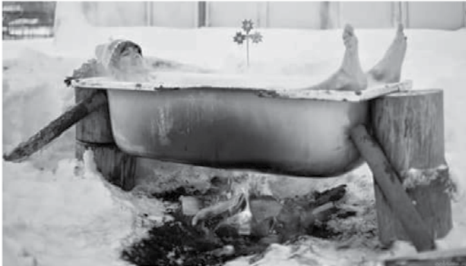
Vsako leto me Miklavž prijetno presenetiti. Letos mi je prinesel toplice.

Dragi odrasli, naj vam namignemo. Kmalu bo Miklavž potreboval darila za vse otroke, tudi za tiste, ki niso bili mogoče ultra visoko pridni. Torej, kaj še čakate, dvignite svoje ta zadnje in nam kaj prinesite. Mislim, pomagajte Miklavžu! Pomagajte Miklavžu!