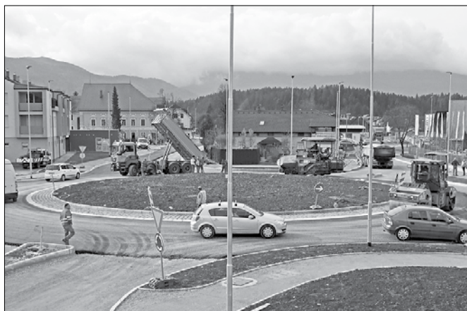
Kakšen krajski objekt bo stal na sredi krožišča, bo znano po izboru predloga na osnovi natečaja, ki ga bodo objavili v začetku prihodnjega leta.

gradu Vrbovec do mostu čez Savinjo. Fino asfaltno prevleko je dobil odsek ceste od centra kraja do križišča pri osnovni šoli. Predvidevajo, da bodo ta petek uspeli asfaltirati še pločnike.