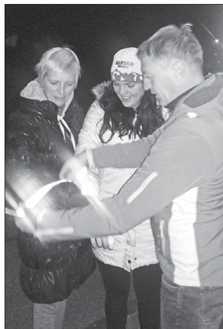
Mimoidoči radi sprejmejo odsevnike in dober nasvet glede ravnanja v prometu.

Člani Sveta za vzgojo in preventivo v cestnem prometu (SPV) Občine Ljubno in policisti Policijske postaje Mozirje so se v večernih urah sredi novembra podali skozi Ljubno, Radmirje, Okonino, Juvanje in druga naselja ter mimoidočim razdelili odsevna telesa in promocijski material, ki so ga prejeli od Javne agencije RS za varnost prometa. Pri tem so sogovornikom namenili kakšen nasvet in prijazno besedo.