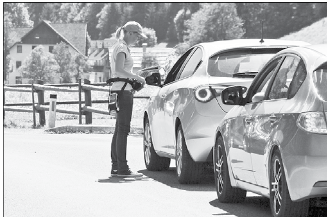
Občina Solčava s podjetjem Logarska dolina d. o. o., ki upravlja s krajinskim parkom, ni dosegla dogovora o porazdelitvi sredstev, ki se stekajo od pobranih vstopnin v Logarski dolini.

Svetniki so se s povedanim v večini strinjali, so pa izrazili bojazn, da bi izdelava upravljavskega načrta za proračun pomenila veliko finančno breme. Izdelava takega načrta je zahtevna in ima svojo ceno, je odgovorila županja. Z eno informativno ponudbo občina že razpolaga, bodo pa jih pridobili še več in nato izbrali