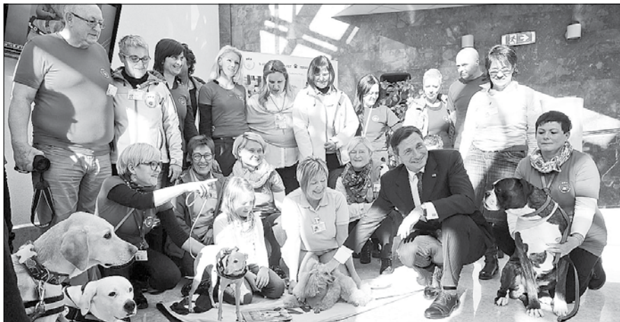
Peti rojstni dan je Zavod PET obeležil z novinarsko konferenco in srečanjem terapevtskih parov z malimi bolniki na Pediatrični kliniki Univerzitetnega kliničnega centra Ljubljana. Priznanje članom je izrekel tudi predsednik države Borut Pahor.

EDEN NAJBOLJ BRANIH SLOVENSКИH PISATELJEV