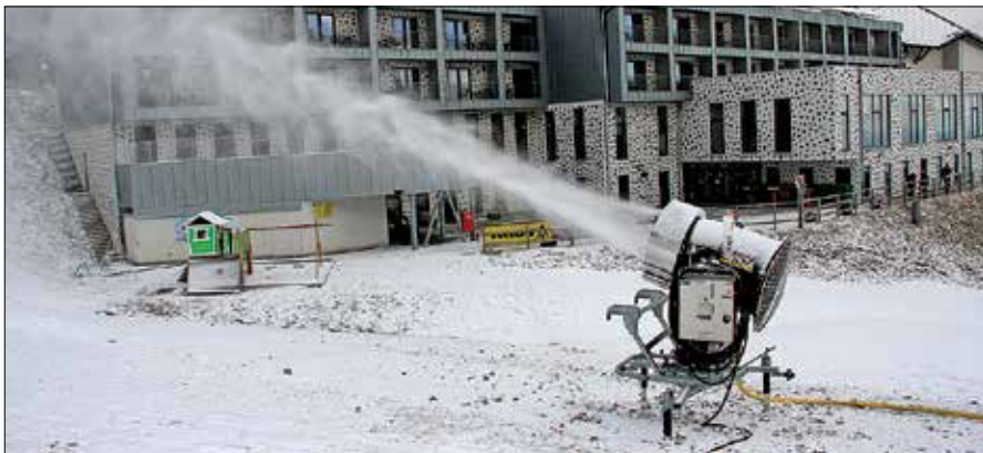
Na Golteh zasnežujejo družinsko progo in smučišče Blatnik z vsemi desetimi snežnimi topovi.