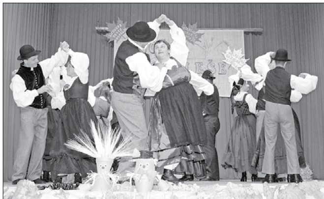
Z venčkom prazničnih so gostje s Črne na Koroškem poželi močan aplavz.

Folklorne plesne so del kulture, ki se prenaša iz roda v rod, za to imajo zasluge številni plesalci, ki delujejo v številnih folklor-nih skupinah po Sloveniji. Ena izmed njih je skupina Kulturnega društva Bočna. Po štirih letih delovanja se lahko po-