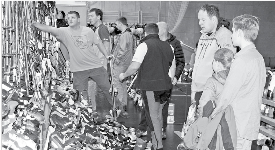
Ljudje so v prodajo prinesli kar 1.430 kosov rabljenih smuči, desk, smučarskih čevljev, palic, čelad, očal in oblačil.