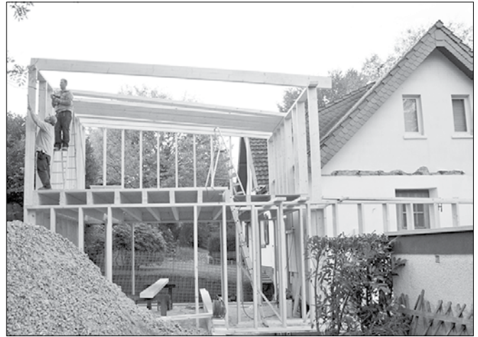
Investitorji najpogosteje gradijo enostanovanjske objekte, nekaj je rekonstrukcij ter prizidav in nadzidav.

Kot na večini področij je tudi gradbena zakonodaja podrejena birokratskim postopkom. Načelnica Upravne enote Mozirje Milena Cigale je povedala, da njihovi strokovni delavci pri delu še vedno uporabljajo pretežno stare prostorske akte, za katere ugotavljajo, da ne ustrezajo več današnjim potrebam in možnostim, njihovo spre-