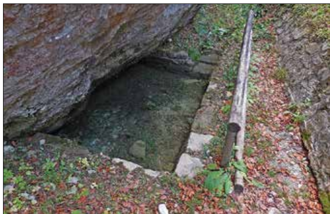
Presihajoči studenec najlepše deluje po obilnih padavinah.

Naraščanje in upadanje vode našega studenca je že davnega leta 1907 opisal znani geolog in seizmolog Ferdinand Seidl. Voda iz zaledja priteka skozi kanale (razpoke) v kamnini do glavnega kanala, ki se nato razširi, da sprejme večjo količino vode. Ta rezervoar ima zaradi ovire odtok samo navzgor, tako ima obliko sifona. Ko voda zapolni ves prostor rezervoarja, se prelije preko odtočnega roba in po principu natege posrka vodo iz sifona ter napolni izvir. Voda v izviru najprej odteka po umetno narejenem kanalu, nato pa naravno pronica in ponikne skozi prodnato dno izvira. Med tem se rez-