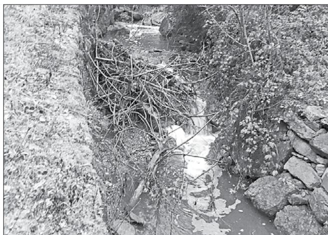
Pristojni so ugotovili, da gre za obilen izliv gnojevke. Kasneje so našli občana, ki je imel napeljšano cev iz gnojne jame v potok.

V soboto, 26. novembra, okrog 16.15 so bili predstavniki Ribiške družine (RD) Ljubno ob Savinji obveščeni, da je prišlo do močnega onesnaženja Lakovnikovega potoka v naselju Strmec v občini Luče. Ob prihodu na kraj so ugotovili, da gre za obilen izliv gnojevke, kar glede na obseg ni mogel biti posledica morebitnega gnojenja travnikov v bližini potoka. O dogodku so nemudoma obvestili Policijsko postajo Mozirje in Regijski center za obveščanje Celje, ki je obvestil pristojne inšpekcijske službe. Zoper občana, ki je imel napeljšano cev iz gnojne jame v potok, so podali kazensko ovadbo na pristojno državno tožilstvo.