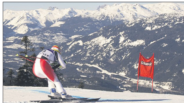
Na prizorišču nastopanja alpskih smučarjev se vreme pogosto spreminja.

pomeni: "Delaj v meri človeške zmogljivosti" in je dopolnilo besede inuk, ki pomeni človek. Ti kamniti spomeniki so bili postavljeni na področje Antarktike in so služili za lov, navigacijo, kot koordinacijske točke, indikatorji in sporočilni centri Inuitov. To ustreza tekmovalnemu in humanitarne duhu dvotedenskih iger v Vancouveru in zblizanju držav iz celega sveta. Za nas osebno pomeni, dobrodošli v Kanado.