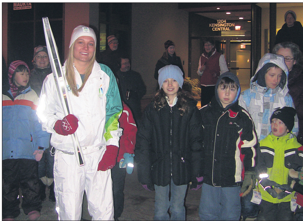
Na poti v Vancouver so olimpijski ogenj ponesli tudi po ulicah Calgaryja.

Pravo olimpijsko razpoloženje se je za nas v resnici začelo 19. januarja 2010, na 82. dan potovanja po Kanadi, ko je šta-