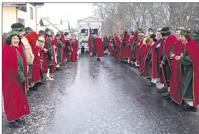
Skupina Rimljani iz Spuhlje je bila nekaj posebnega, a očitno ni prepričala komisij ne v Markovcih in ne na Ptuj.

šenka, je bilo med blizu 2000 maskiranimi letos okoli 400 korantov z dvema skupinama oračev, kar 41 kopjašev, pa številni piceki, kokotiči, vile, ruse, medvedi in gamele. Poleg karnevalskih skupin iz markovske in vseh sosednjih občin so nastopile lepo naše mlade pustne skupine iz Vrta in Osnovne šole Markovci, med gosti iz tujine pa so letos nastopili skupina Pustvi iz Kostanjevice na Krki, Liški pustje iz Kanala na Soči, etnografska skupina iz Slovaške, iz Srbije pa skupina pokačev in trubačev. Sicer pa je komisija z župa-