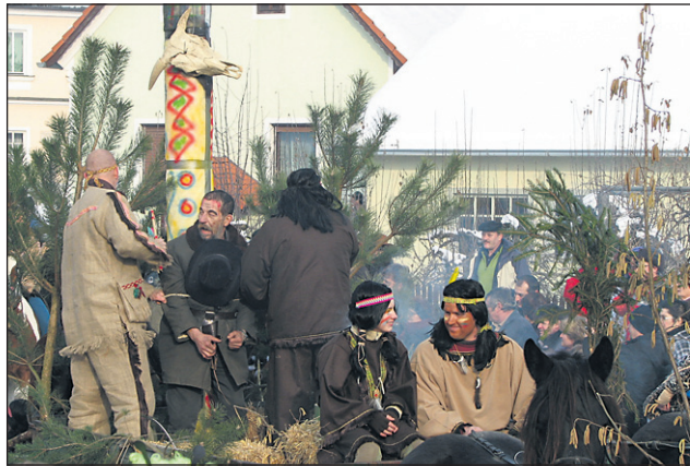
Prvo mesto so si prislužili Indijanci Konjeniškega društva Središče ob Dravi.