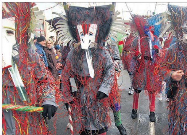
Svojo inovacijo so dijaki in učitelji predstavili tudi na nedeljski povorki.

Prvič so si Ptujčani in obiskovalci omenjeno inovacijo lahko ogledali na nedeljski po-