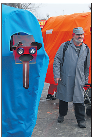
Elektro kurente so spremljale elektro ruse.