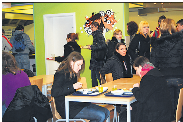
Dijaki so razočarani.

Kot je na novinarski konferenci po seji vlade pojasnil minister za šolstvo in šport dr. Igor Lukšič, je dosednji zakon obsegal le področje dijaške prehrane, z novim pa subvencijo širijo tudi na področje osnovnih šol in s tem po njegovem mnenju uvajajo višjo stopnjo pravičnosti. Kot je dejal Lukšič, pa si tudi sam želi, da bi se subvencija za dijaško prehrano postopno povečevala in bi v bližnji prihodnosti, ko bodo to omogočala sredstva v državnem proračunu, prišli do tega, da bi bila šolska prehrana v