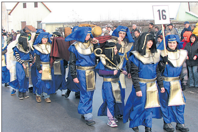
Šolske skupine so se vse zelo potrudile, zato je imela komisija težko delo. Zmagali so Egipčani, učenci 8. razreda OŠ Središče ob Dravi.

Ptuj • Projekt Elektro in računalniške šole