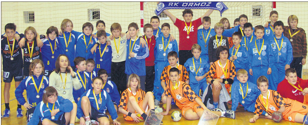
Najboljši mladi rokometaši na turnirju v Ludbregu