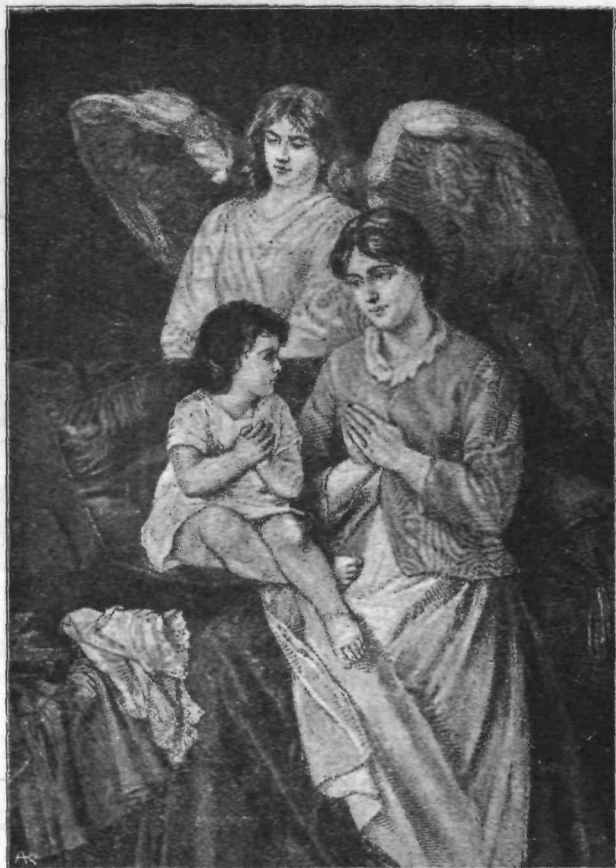
»Preljubi angel varuh moj!«